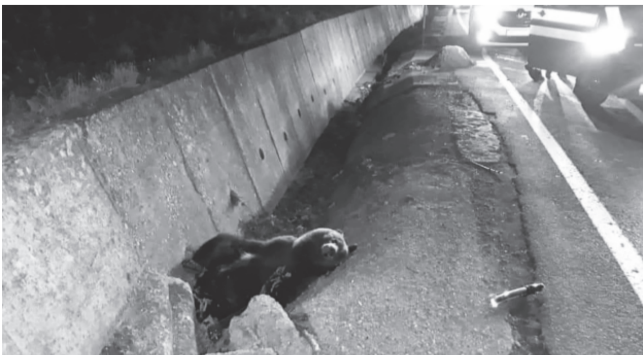
A gázolást élve megúsza a medve, de nem tudni, hogy túl is éli-e.

Az utóbbi napokban az országban ez a hatodik medvegázolás, Maros megyében augusztus óta ugyancsak hat nagyvadat ütöttek el. (g. r. l.)