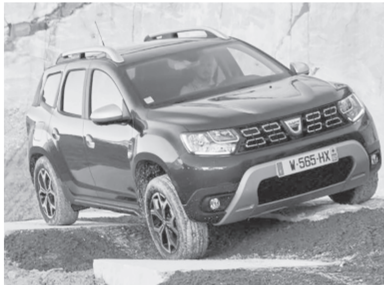
A Dacia Duster legnépszerűbb kis méretű SUV az európai piacon

A szintén Romániában gyártott Ford EcoSport egy hellyel az ötödik pozícióra lépett előre. Eladásai 12 százalékkal csaknem 94.000 egységre nőttek. A romániai piacon tíz hónap után a Ford EcoSport a második legnépszerűbb a Duster után, előbbinek 11 százalékos, a Dacia modelljének pedig 37 százalékos a piaci részesedése. (Mediafax)