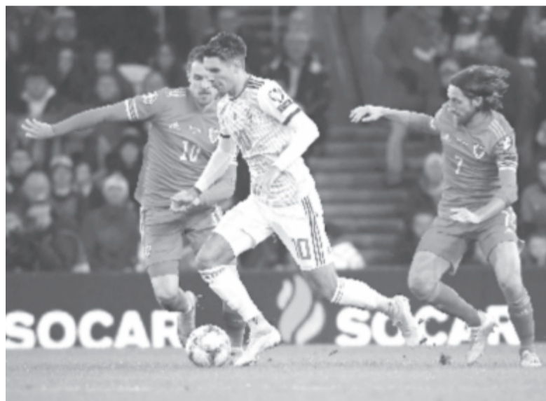
Szoboszlai Dominik (k), valamint a walesi Aaron Ramsey (b) és Joe Allen a Wales – Magyarország labdarúgó-Európa-bajnoki selejtező mérkőzésén a cardiffi városi stadionban 2019. november 19-én