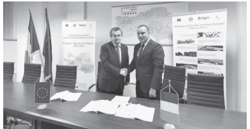
Nem kis beruházást hoz a kisvárosnak a szerződés

A projekt a kórház épületének korszerűsítését és bővítését, valamint a járóbeteg-ellátás minőségének javulását