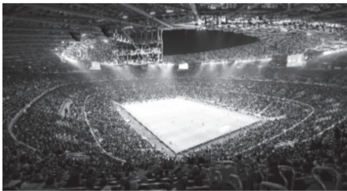
A Puskás Aréna avatásán játszott Magyarország – Uruguay barátságos labdarúgó-mérkőzés 2019. november 15-én.

Az egyetlen kritikai észrevétel a büfét illette, mert a stadion bizonyos részein nagy sor alakult ki. A legfelső, harmadik szinten helyet foglaló nézőhúszperces sorra panaszkodott, ugyanakkor az aréna más részein lévő szurkolók szerint legfeljebb tíz percet