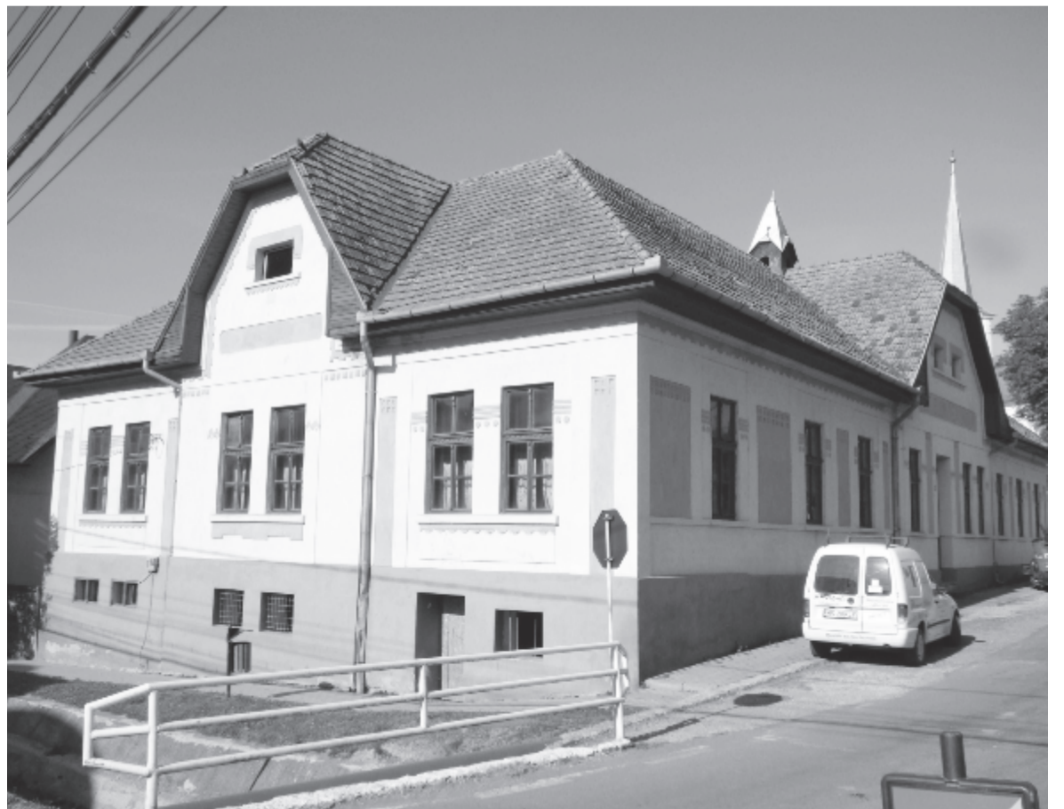
Az egykori felekezeti iskolát alakítják át bölcsődévé

beindítása. Úgy véli, lesz elég jelentkező, amikor erre sor kerül. A bölcsőde ugyan a koronkai gyerekek számára volt elképzelve, de ha lehetőség lesz rá, marosvásárhelyi szülők is vinnének át gyerekeket a szomszédos településre. Jelenleg a koronkaiak kénytelenek bevinni gyerekeiket a városba, de ott hosszú a várólista, nem mindenkit tudnak felvenni, így többen arra kényszerülnek, hogy nagyszülőkre bizzák őket, és több szülő is folyamatosan keres olyan személyt, akire rábízhatná kicsinye felügyeletét.