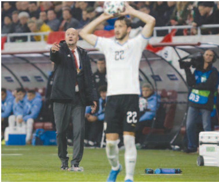
Marco Rossi dirigál az Uruguay elleni mérkőzésen.