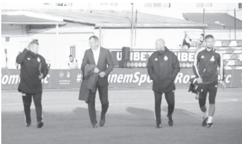
A háromszéki csapat szakmai stábjába (középen a vezetőedző) levonul a pályáról a megyesiek elleni mérkőzés végén: ez volt az utolsó.