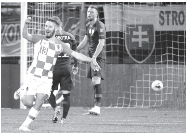
A horvát labdarúgó-válogatott hátrányból fordítva 3-1-re legyőzte szombaton a szlovák csapatot.

A horvát labdarúgó-válogatott hátrányból fordítva 3-1-re legyőzte szombaton a szlovák csapatot az Európa-bajnoki selejtezősorozat magyar érdekeltőségű csoportjában, amelyből így elsőként jutott ki a kontinensviadalra. A fumei találkozón a vendégek alaposan ráijesztettek a világbajnoki ezüstérmes együttesre, amely azonban a másod-