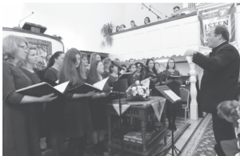
A Hozsánna vegyes kar