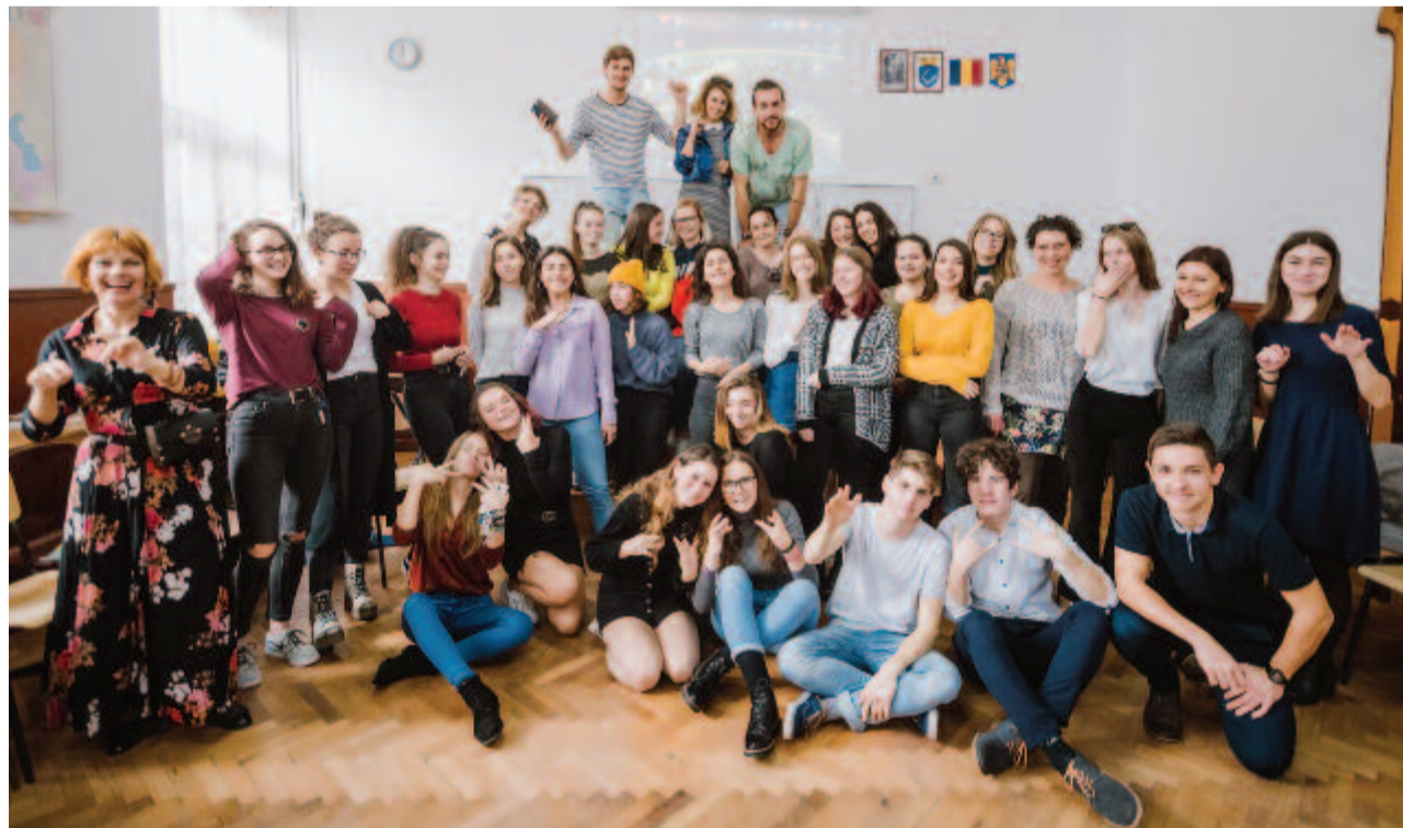
Bolyais diákok körében

A csapat lelkesedését látva, biztosság lehetünk munkájuk eredményében, hatásában, és miközben együtt keresik a jó válaszokat a fiatalok kényes kérdéseire, sikerül a színészek munkáját értékelő, igényes színházlátogatókat is nevelniük.