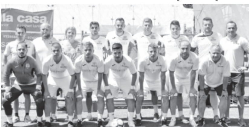
A Nova Vita a marosvásárhelyi bajnokság után az országosat is megnyerte, majd indult a Bajnokok Ligájában, amelyben ezüstérmes lett