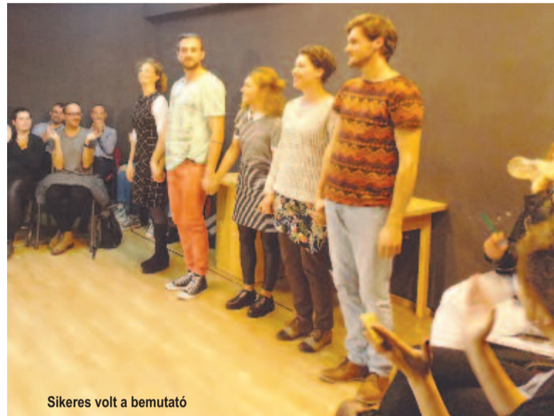
Sikeres volt a bemutató

– Ha nagyon visszavezetem, az ötlet sepsiszentgyörgyi középiskolás koromból ered. Akkoriban úgy éreztem, hogy senki sem kíváncsi a véleményemre, holott lett volna, de mivel nem mondhattam el, kirekesztettnek éreztem magam. Nagy lázadó voltam a tanárok ellen, hogy