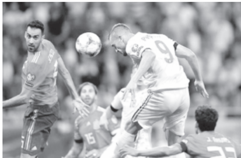
Ahhoz, hogy a román válogatott részvételi jogot szerezzen a jövő évi Európa-bajnokságra, a svédek elleni bukaresti győzelmet meg kellene fejelelni legalább egy spanyolországi döntetlennel.

let, ugyanis a már Eb-résztvevő lengyelek mögött az osztrákoknak hátralevő két találkozójukon egyetlen pontra van szükségük a továbbjutáshoz, ezt már pénteken, hazai pályán megszerezhetik Észak-Macedónia ellen.