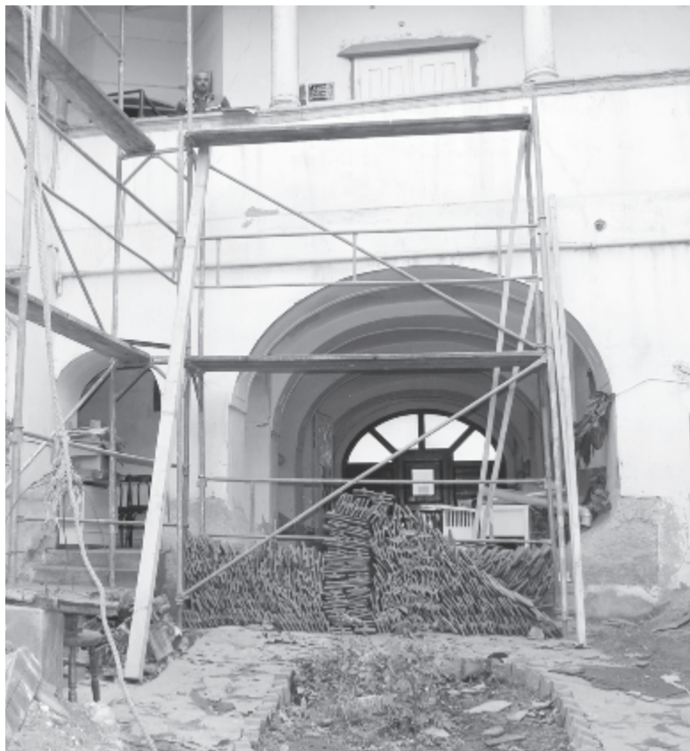
A belső udvar