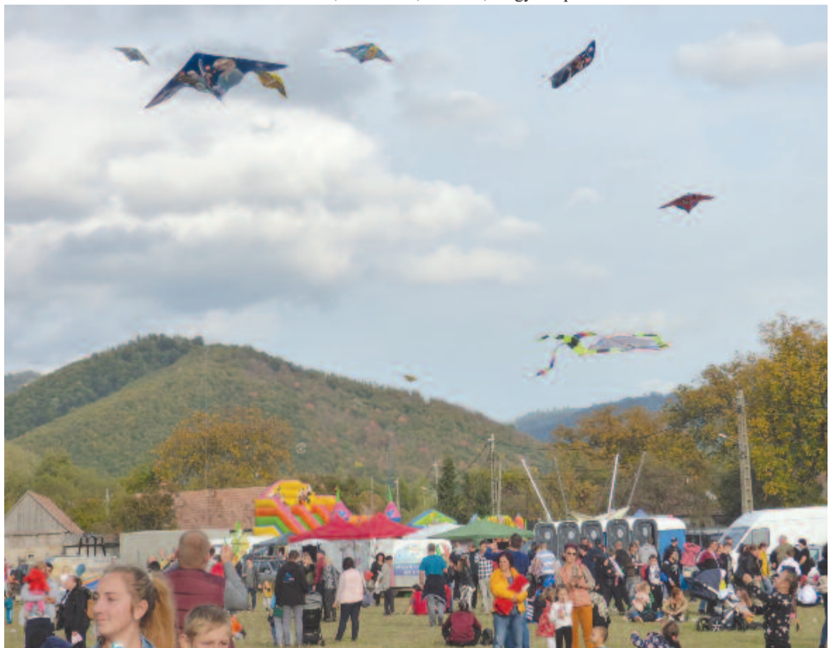
Nemcsak léggömbök, hanem kis és nagy sárkányrepülők is szálltak a levegőben

rok és hazaiak. A másik az idei turistaszám: egyesek úgy saccolták, hogy már szombaton elérte ez a szám a húszezret, de ő valamivel kevesebbre teszi, úgy véli, hogy a három nap alatt a látogatók száma elérte a harmincezet, ami a fesztivál tizennégy éves időszakában a csúcst is jelenti. Az eddigi tapasztalatok szerint vasárnap volt a legtöbb vendég, idén azonban szombaton állt be a csúcs, olyan pillanat is volt, amikor másfél óra alatt lehetett a faluból kijutni a megyei útra. Mivel a széljárás nem volt a legkedvezőbb, a léggömböket ki kellett vinni a völgyből, hogy felszállhassanak, probléma volt az áramellátással is, de megoldották, így minden a programnak megfelelően zajlott. A legnagyobb kérdést számukra azonban a forgalom jelenti: a vármezői út nagyon keskeny egy ekkora tömeg számára. Eddig is nehézkes volt a közlekedés a fesztiválok idején, de most egyszerűen bedugult – magyarázta a főszervező, aki tudatában van annak, hogy nem tudtak minden téren a legjobban teljesíteni, és hogy a jövőben egyes kérdéseken még dolgozniuk kell: „fel kell készülnünk, ha ekkora tömeget mozgatunk meg”. A szervezést hatfős stáb irányította, ehhez csatlakozott számos önkéntes és barát, hogy kézben tarthassák a fesztivál levezetését – árulta el lapunknak Lőrincz Miklós.