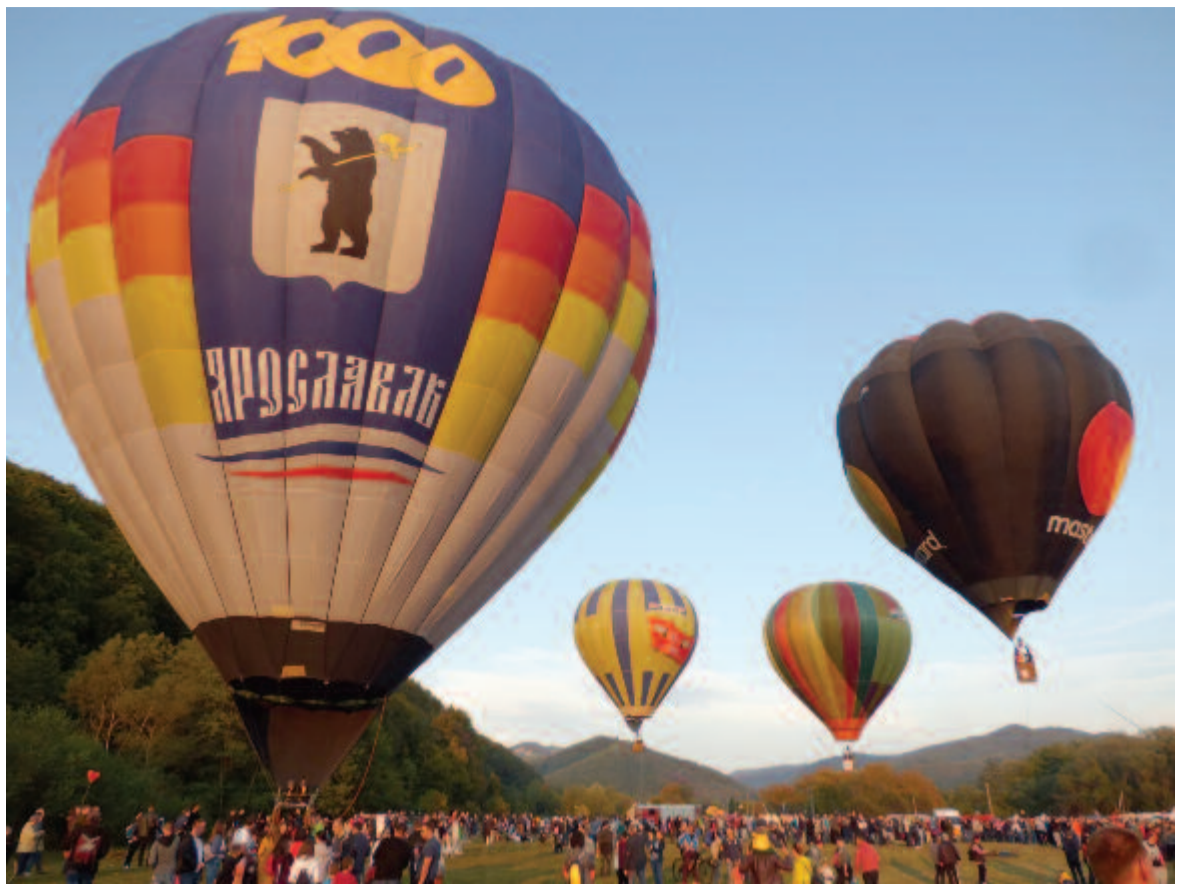
Nem mindennapi élmény a felszálló színes hőléggömbök látványa.

A hétvége viszont a hőlégballoonokról szólt, így természetes, hogy a legapróbb gyerektől a legidősebb látogatóig mindenki ezek megjelenését várta, és pillanatok alatt hatalmas tömeg gyűlt össze egy-egy autó körül, és nagy érdeklődéssel követték, hogyan szerelik össze a kosarakat a hajtómotorral és hogyan fújják fel a lángnyelvek kísérette forró levegővel a többi autóhoz kikötött, hatalmas vászonszakókat, míg azok „talpra” nem állnak. Ezután igyekeztek beszélni – már akinek sikerült jegyet szereznie. A szabad repülés során távolabbra is lehetett utazni,