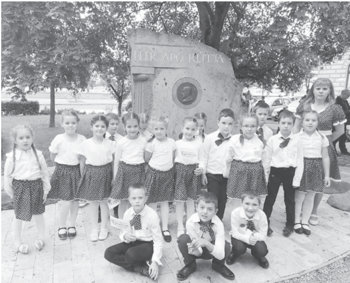
A szeredai apróságoknak nagy élményben volt részük