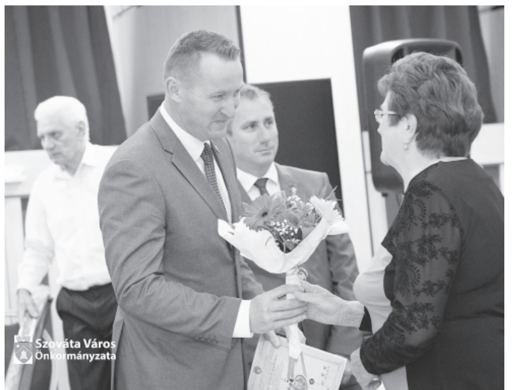
Az önkormányzat minden évben felköszönti a városbeli idősebb korosztályt és kerek házassági évfordulót ünneplő párokat

kelyudvarhelyi színművész volt. Az önkormányzat – Molnos Ferenc helyi tanácsos javaslatára – tíz éve köszönti az aranylakodalmas házaspárokat, és azokat is, akik 55 és 60 éve kötötték össze életüket: idén 14, 7 és 3 ilyen házaspárt számlálhattak. A tánc kevésbé, de az énekés annál jobban ment a vendégeknek, és este mindenki elégedetten, mosollyal, köszönettel és hálattal szívvel távozott. Az idősek szállítására minden évben az önkormányzat buszjáratot biztosít, a köszöntött házaspárok oklevelet, virágot, ajándékot és fényképet is kaptak – mondta el lapunknak a polgármester, és hozzátette, minden évben szeretnének egy picit emelni az előző év színvonalán. (gigor)