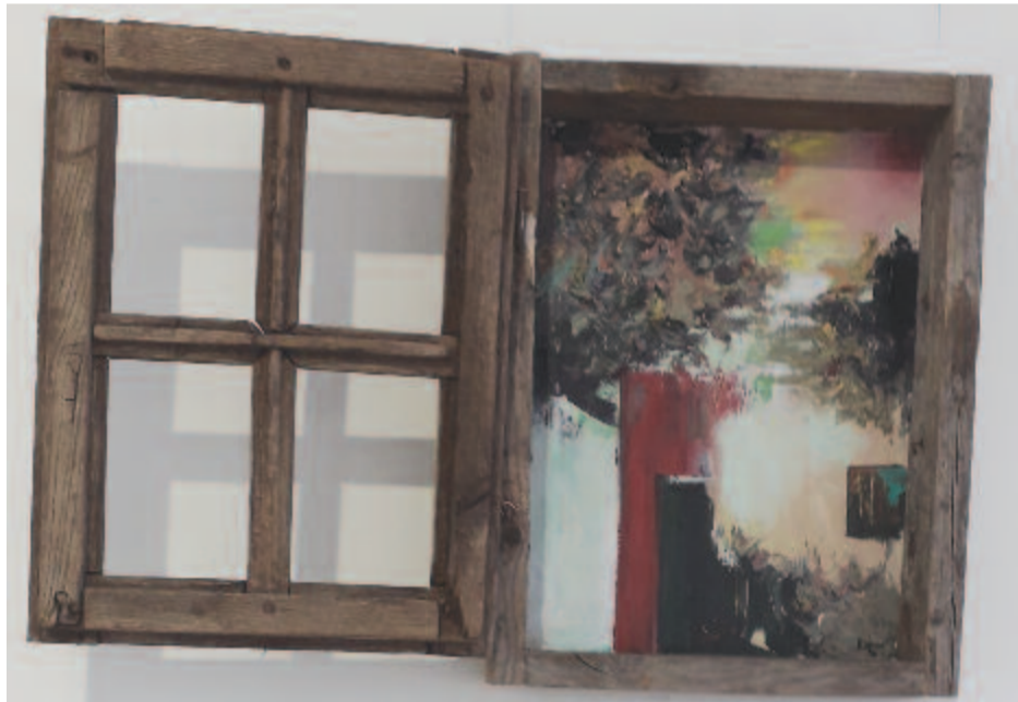
Horváth Levente munkája