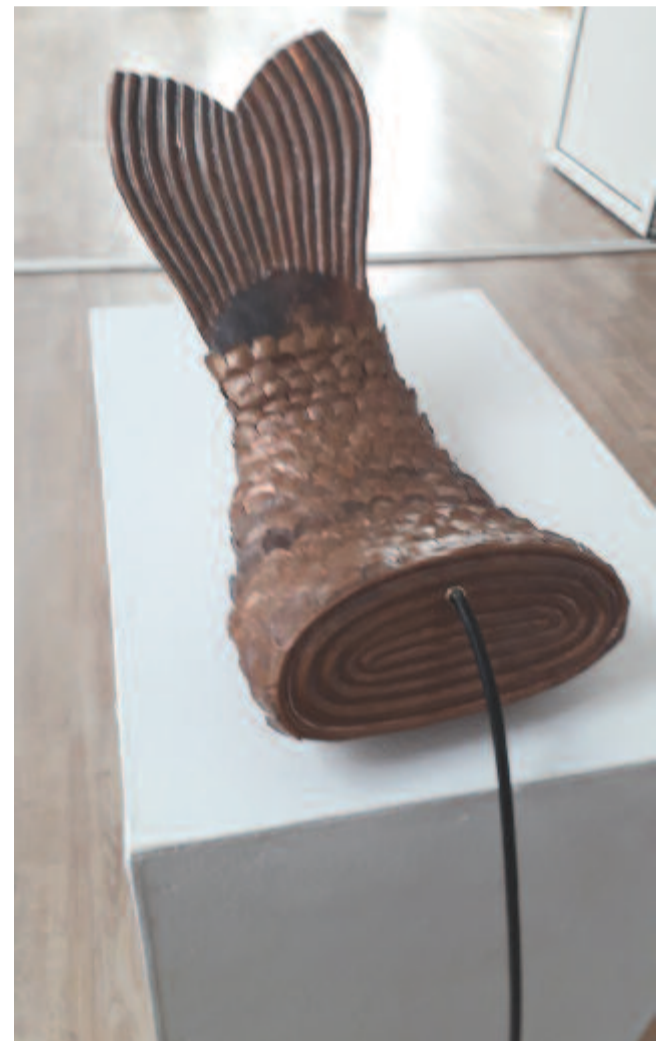
Makkai István: Hal (kinetikus szobor)