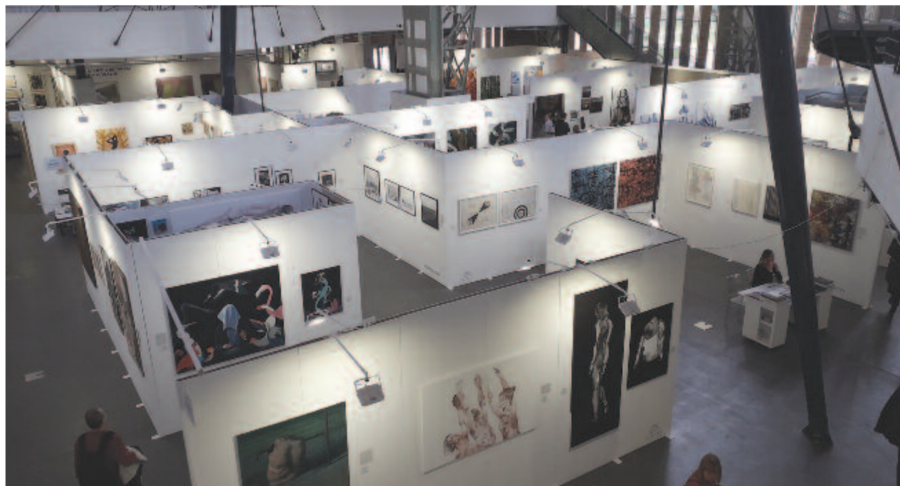
A nagycsarnok egy részlete