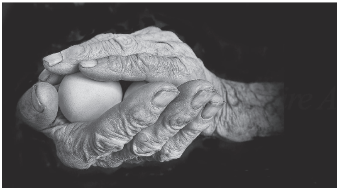
Tordai Ede fotója az album borítóján

Az az év mindig különleges, amikor a Marx József Fotóklub országos biennálét és nemzetközi fotószalont rendez, ilyen az idei is, 27. alkalommal az előbbi, kilencedszer az utóbbi kerül megrendezésre. Fiatalos energiákat, hozzáértést, kifogyhatatlan egyszerűtétet igénylő kihívás ez is. Állnak elébe. A hat és fél évtizedes múlt, a megszerzett hírnév erre kötelezi mindannyiukat. Ugyanígy annak a tudata, hogy nyitott a világ, ma már mindenki utazik, mindenki fényképez, kéznél a maroktelefon s abban a kamera, naponta fényképek milliárdjai keringenek a világhálón. Megszámlálhatatlan kivételes, rendhagyó, lélegzetelállító felvételt rögzíthetnek az emberek. De a véletlen csak ideig-óráig segíthet, igazán jó fotóssá az válhat, aki tehetségét, adottságait olyan tudatos, átgondolt munkával, tanulóssal, egymást segítő vélemény-cserével fejleszti, ahogy a marosvásárhelyi klubtagok tették és teszik évek óta. Kívánjuk, hogy még sokáig nekik dolgozzék az idő!