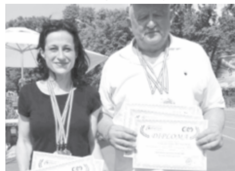
dezendő veterán atlétikai Balkán-bajnokságon. (czimbalmos)

Mindkét veterán sportoló részt vesz a szeptember 19-e és 23-a között Bukarestben ren-