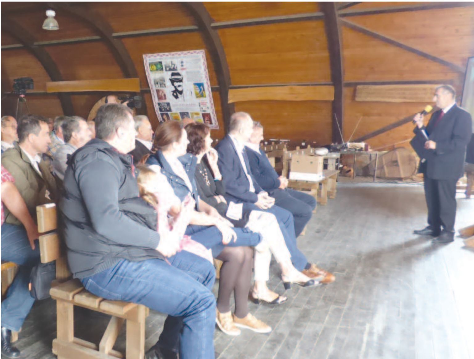
Tavaly még Mikházán volt a gazdanap