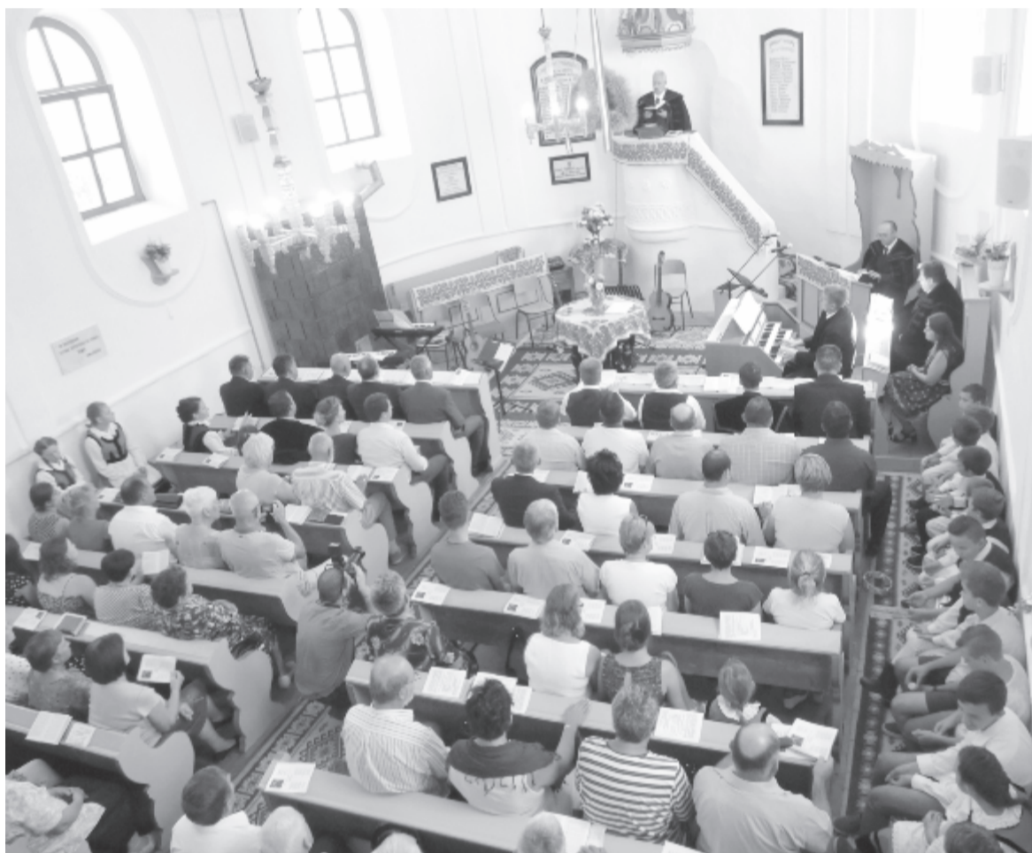
A megújult református templomban ünnepeltek a szentgericeiek