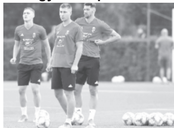
Telkiben gyűltek össze a kerettagok, innen ma utaznak el Podgoricába.

A magyar válogatott csütörtökön Montenegróban játszik felkészülési mérkőzést, négy nappal később pedig Szlovákiát fo-