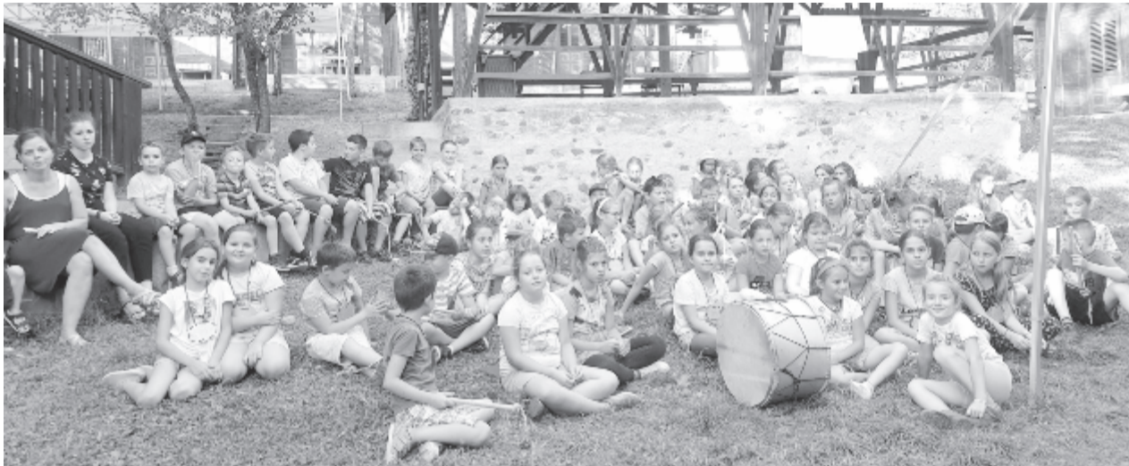
Idén nagyon sokan vonultak be a királyi udvarba