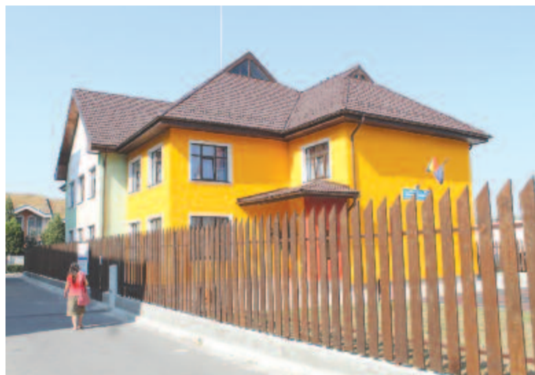
Az új napközi

Az egyik legfontosabb beruházás a székelykakasdi ivóvíz- és szennyvízhálózat kiépítése. A másfél millió eurós munkálatra még 2017 szeptemberében írták alá a szerződést, a tervező azonban majdnem 8 hónapot késleltette a munkálat rajtját. A munkakezdési engedélyt