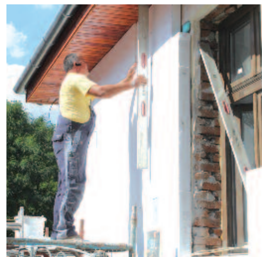
Megújul a bordosi iskola

Nem gondolt arra, hogy külföldön vállaljon munkát, úgy érezte, hogy itthon is meg tud élni, el tudja tartani a családját, és mindez megvalósult – mondja, majd hozzátesszi, hogy bővíteni szeretné a céget, és reménykedik abban, hogy továbbra is talál megfelelő szakembereket.