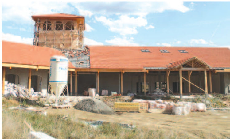
Épül a kelemetelki művelődési központ

– Az évek során bebizonyosodott, hogy Gyulakuta községet életerős, magát jól megszervezni tudó közösség lakja, mellyel eredményesen lehet dolgozni a közös célok eléréseért – zárta beszámolóját a polgármester, majd hozzátette: már csak az a fontos, hogy a lakosság értékeli-e, tud-e örülni, tudja-e rendeltetésszerűen használni mindazt, ami előbb-utóbb a rendelkezésére áll.