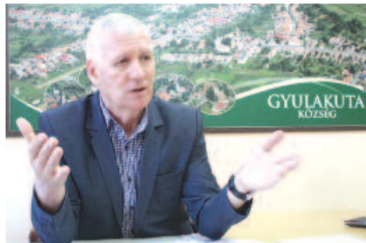
Varga József polgármester

2019-ben húsz célpont megvalósítását tűzte ki a helyi tanács, ötöt európai uniós pályázatokból, tízet kormánypenzékből és ötöt saját jövedelemből, s közben igyekeztek minden település legfontosabb igényeire egyformán odafigyelni.