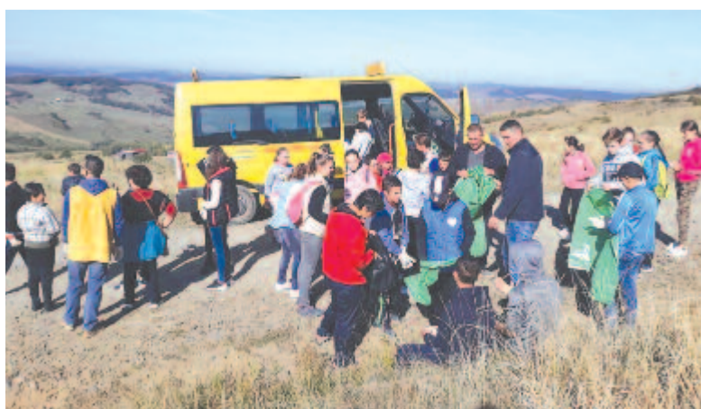
A magyarósi gyerekek a Bekecsen kezdték el a takarítást