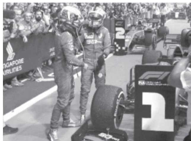
A 2017-es Magyar Nagydíjon fordult elő előzőleg, hogy az első és a második helyen is a Ferrari autója végzett.

A Ferrari négyeszeres világbajnok német versenyzője, Sebastian Vettel nyerte vasárnap a Forma-1-es Szingapúri Nagydíjat. A 32 éves pilóta pályafutása során 53. alkalommal, Szingapúrban pedig ötödször győzött. A második helyen csapattársa, a monacói Charles Leclerc, a harmadikon pedig a Red Bull holland pilótája, Max Verstappen végzett. Az ötszörös vb-győztes, címvédő brit Lewis Hamilton negyedik lett a Mercedesszel a világyfényes utcai versenyen.