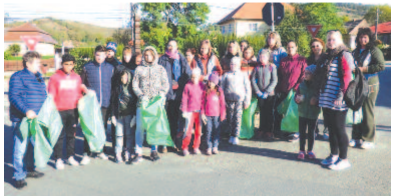
Gyerekek és felnőttek egyaránt dolgoztak Koronkában

Marosszentgyörgy is minden évben csatlakozik az országos takarítókampushoz, idén is meghirdették a helyiek számára, de céltudatosan az iskolát szólították meg. Szombaton délelőtt mintegy