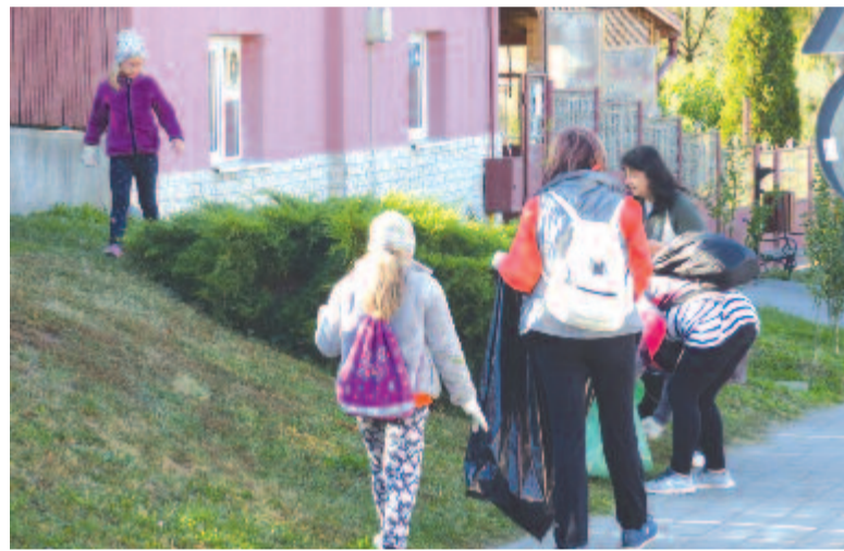
A legtöbb diák Nyárádremete községben jelentkezett önkéntes munkára.

Nyárádmagyarós községben a tavaly is bekapcsolódott az iskola ebbe a kezdeményezésbe, az Iskola másként héten is gyűjtenek szemetet, a tavaly ősszel az önkormányzat felkérésére dolgoztak néhány órát – tudtuk meg Aszalos Erika tanárnőtől. A hétvégi jó időben mintegy 50 diák és tíz felnőtt indult fel a Bekecs derekára, ahonnan visszafele jövet az utak mentén Magyarósig gyűjtötték össze a hulladékot, mintegy tíz kilométeren, míg a kisebbek Selyében takarítottak. A gyerekek