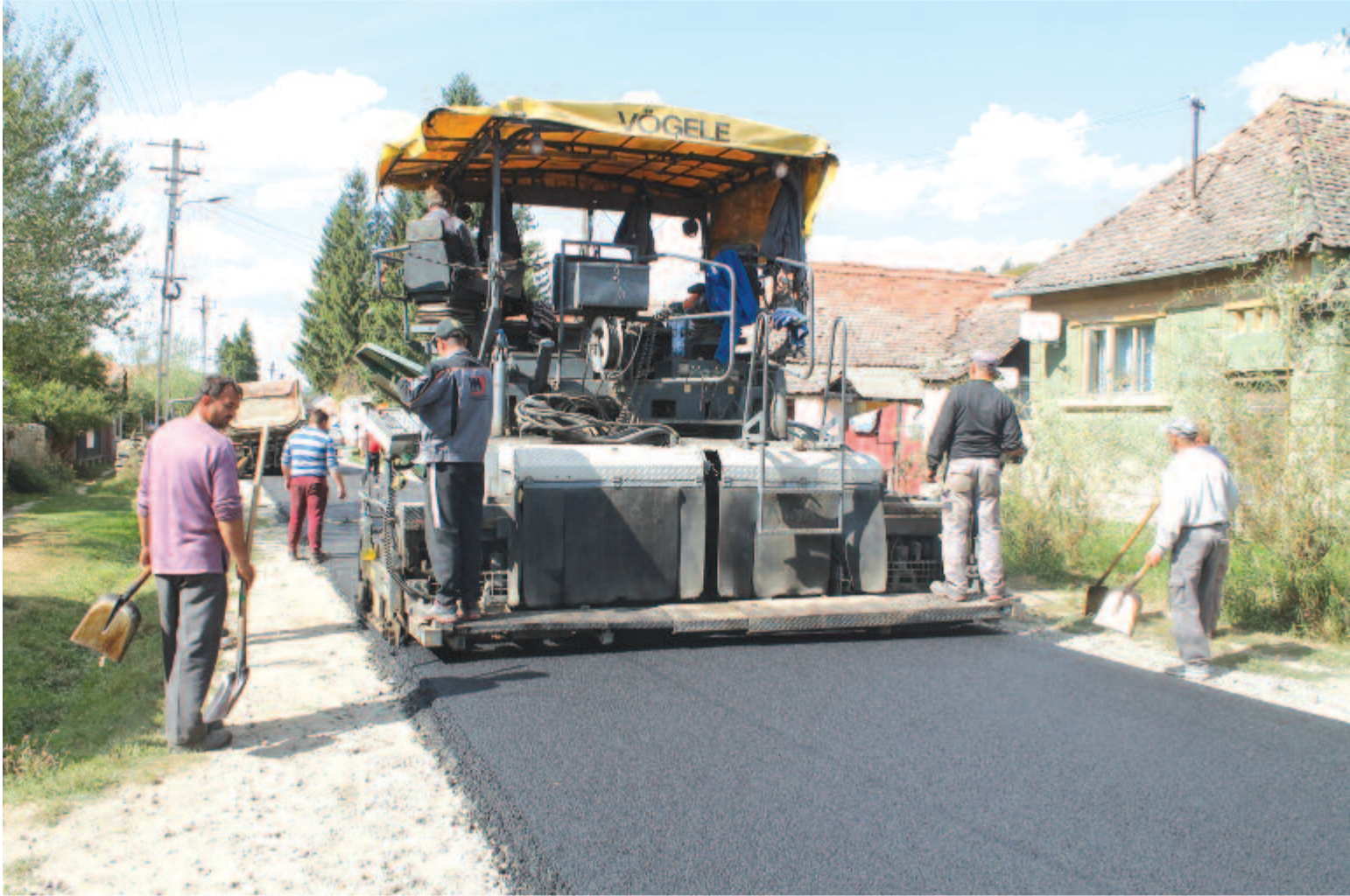
Aszfaltoznak Rava központjában. Gyulakutai vendégoldalunk a 6. oldalon