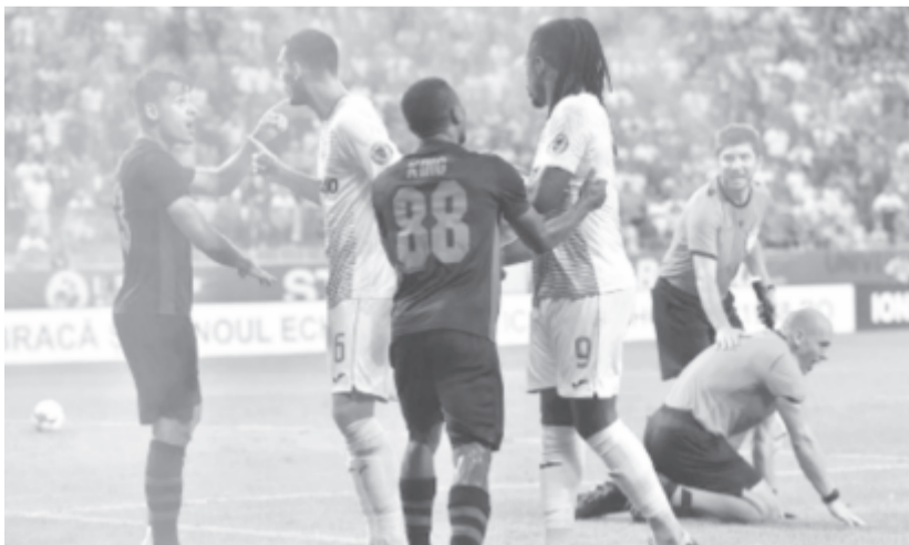
Miközben a játékosok egymással kakaskodtak, a játékvezető közvetlen közelében robbant fel egy pályára bedobott hanggránát

A Craiova a selejtező következő, harmadik körében búcsúzott a görög AEK Athénnal szemben.