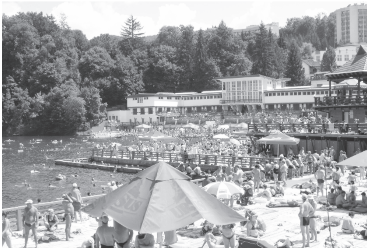
Az idén augusztus 11-én fürödtek a legtöbben a tóban