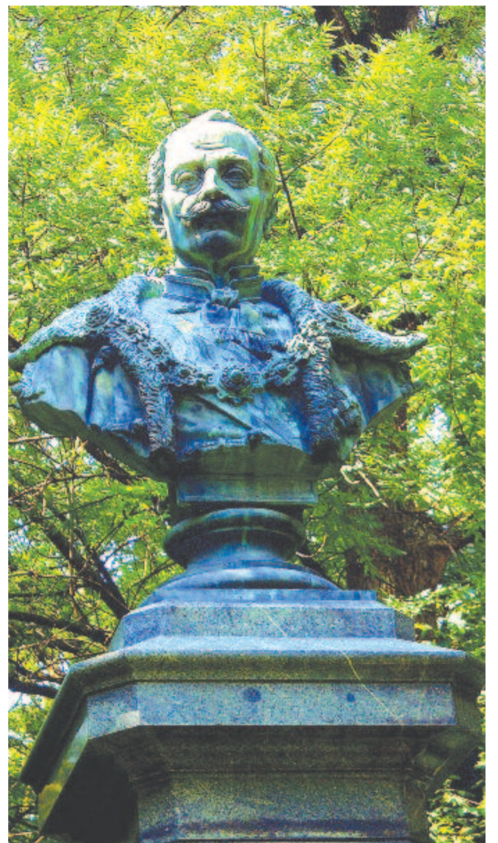
Mikó Imre szobra ma

175 évvel ezelőtt, 1844. szeptember 2-án halt meg Lőcsén Genersich Sámuel orvosbotanikus. 1798-ban adta ki A cipszer flóra