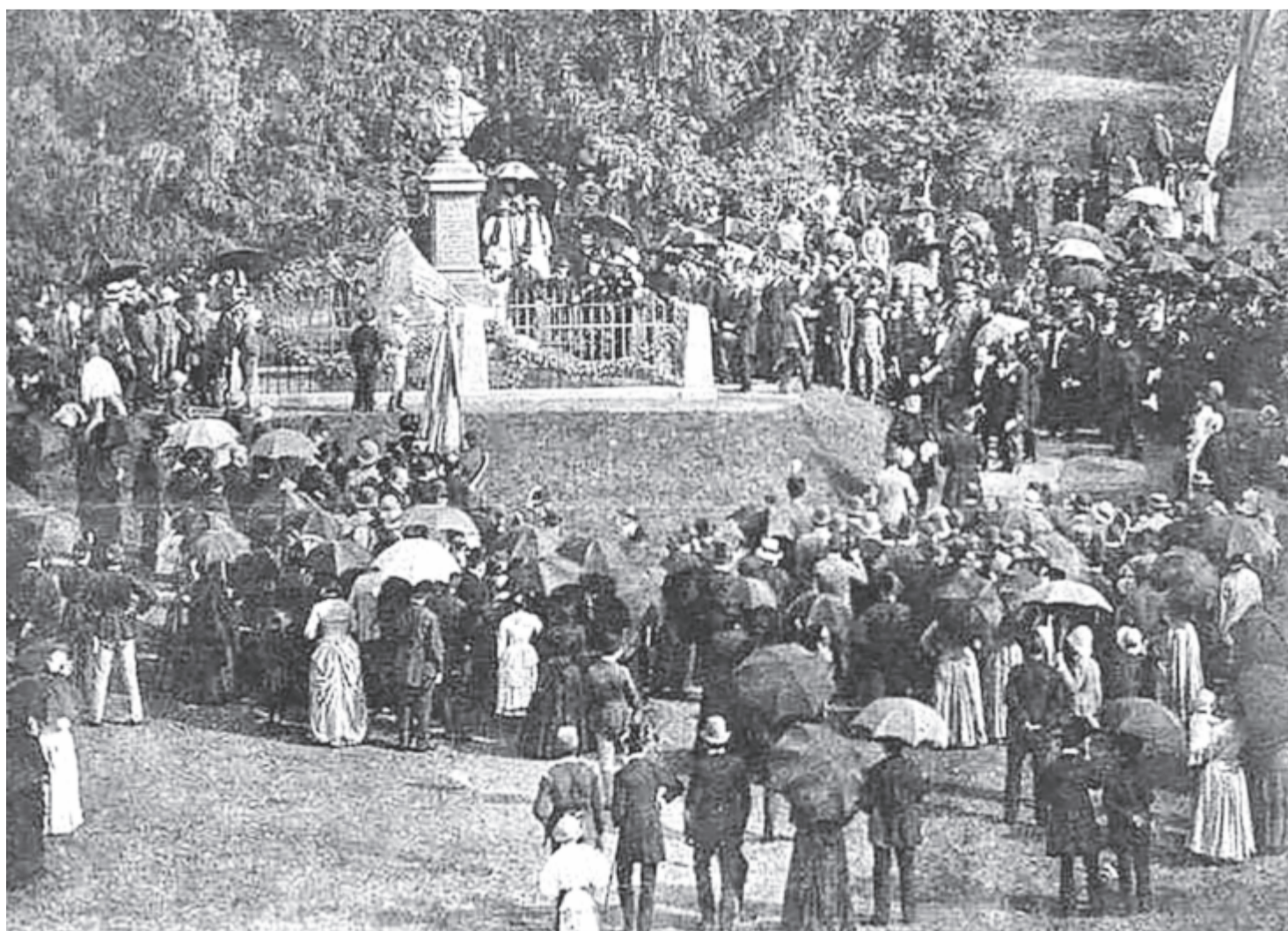
Gróf Mikó Imre szobrának leleplezési ünnepélye Kolozsvárt

Kelt 2019-ben, mérleg hó kezdete előtt két nappal