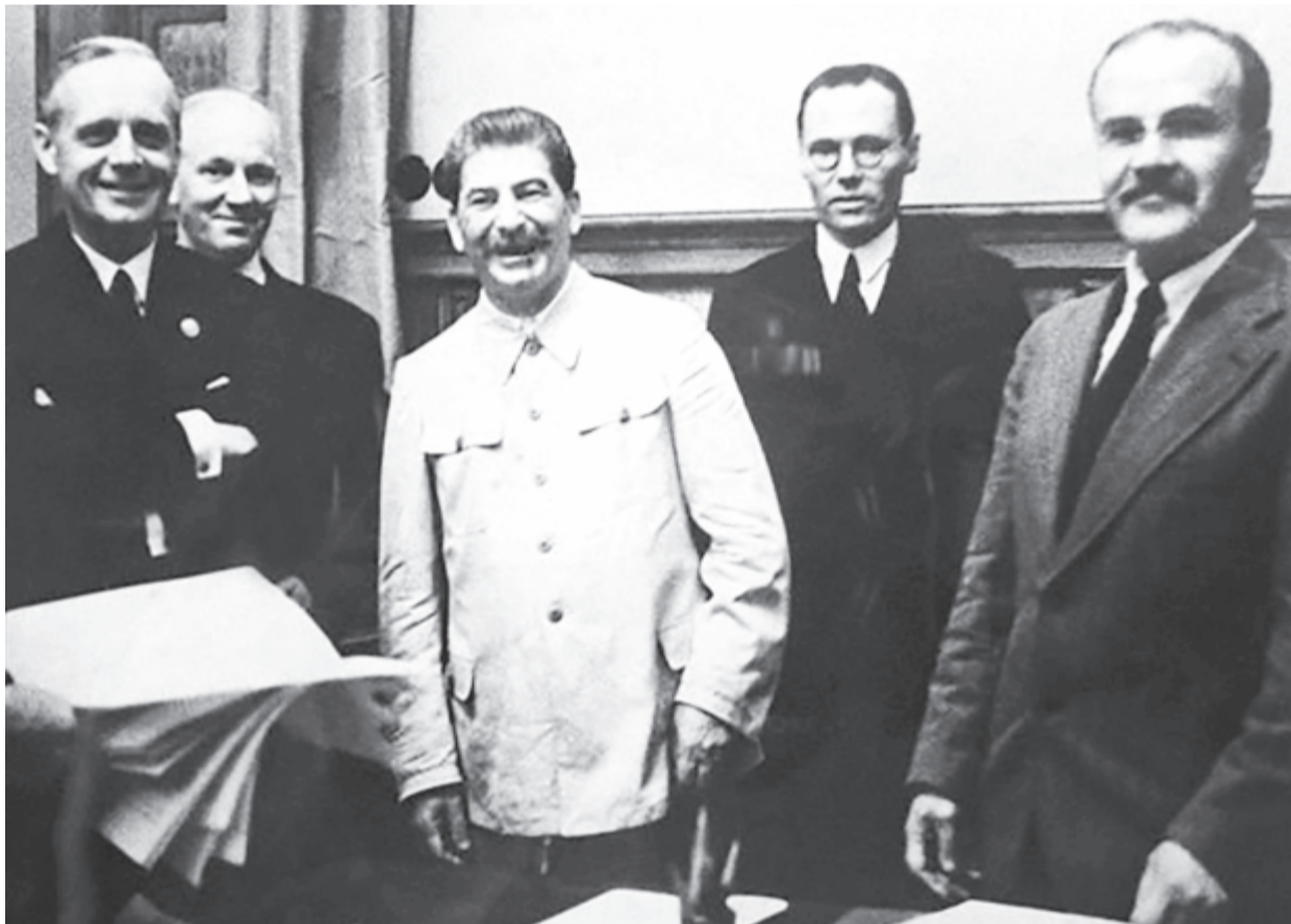
A paktum aláírásakor készült felvétel előterében balról jobbra: Joachim von Ribbentrop német külügyminiszter, Sztálin és Vjacseszlav Molotov szovjet külügyi népbiztos