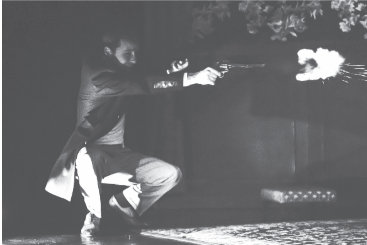
A láthatatlan hóhér

A kezdődő évad előadásaira a jegyeket ezúttal is a színház Kulturpalotában működő jegyirodájában: kedd-péntek 12-17.30 óra között (tel. 0372-951-251), a színházban működő jegypénztárban: kedd-péntek 9-15 óra között, valamint előadás előtt egy órával (tel. 0365-806-865) és a www.biletmaster.ro oldalon lehet megvásárolni. (Knb.)