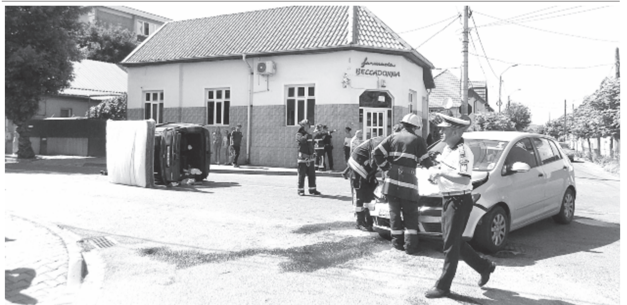
A nagy meleg miatt a gépkocsivezetők figyelme is lankad. Feltehetően ezért nem vette észre a bánáti rendszámú autót vezető fiatal hölgy a Radnai és a Iuliu Maniu utcák kereszteződésénél levő stoptáblát, és belerohant a Iuliu Maniu úton matracot szállító személygépkocsiba, amely az oldalára dőlt. A helyszínrre több rendőrautó és egy tűzoltókocsi is kivonult.

A vásárhelyi koncertre július 3-án, ma este 7 órától a Marosvásárhelyi Nemzeti Színházban kerül sor. Jegyek a билетmaster.ro és eventbook.ro oldalakon, valamint az esemény előtt a helyszínen kaphatók.