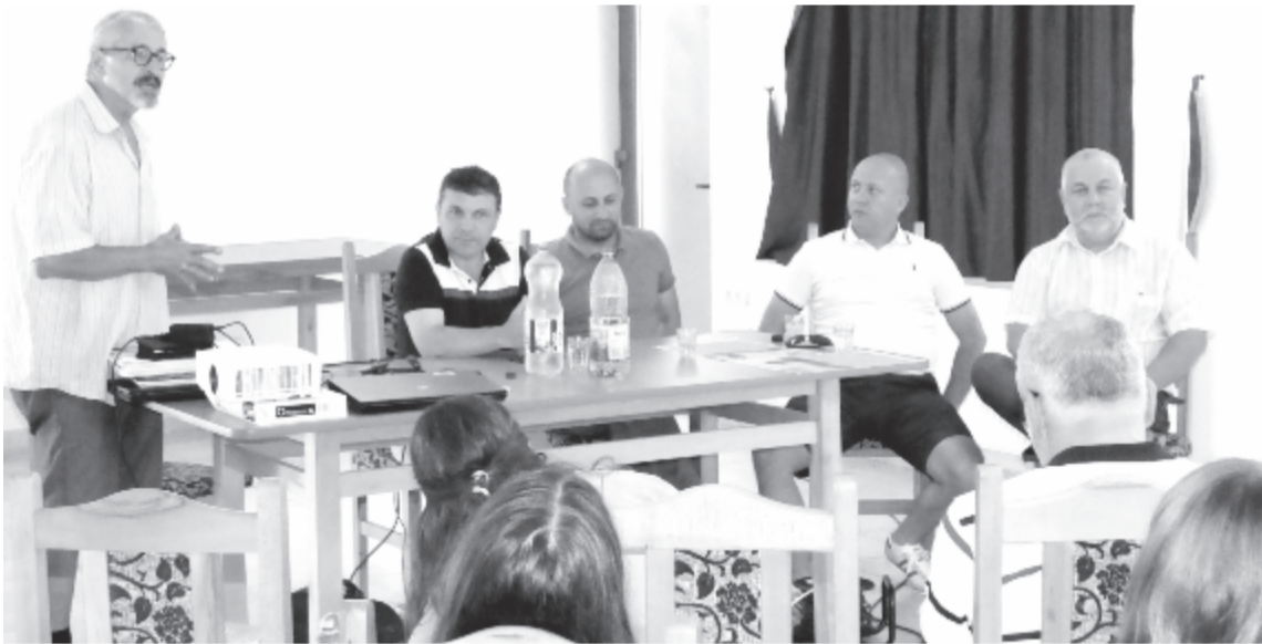
Első este négy nyárádmenti polgármester számolt be a térség EU-csatlakozás utáni helyzetéről