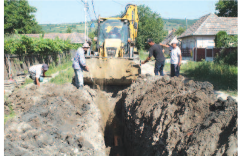
A sövényfalvi csatornahálózat építése

A tervek szerint a szennyvizet Sövényfalváról Királyfalvára szivattyúzzák, a Nagyhangáson keresztül pedig Küküllődombó érintésével halad majd a szennyvízvezeték Dicsőszentmárton irányába. Amint beszélgetésünk során hangsúlyozta, fontos a munkálatok elvégzésének sorrendje, mivel a szennyvízhálózat lefektetését az aszfaltozás és a járdák felújítása követi. A munkagépek hiánya egyre nyilvánvalóbb volt, ezért vált szükségessé egy saját buldozorkavatót, amit 56.000 eurós pályázattal sikerült beszerezni.