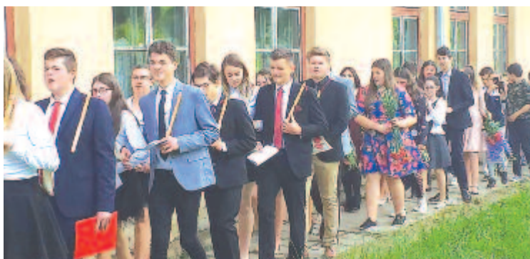
Ballagás a küküllődombói iskolában

jaink. A tanulás mellett a nevelés és a közösségformálás sem maradt el, szüreti bál, farsang, vallásos és történelmi megemlékezések, önkénteskedés, kirándulások tették színesebbé a tanévet. A képességvizsga kapcsán megtudtuk, hogy viszonylag jól szerepeltek, talán a román nyelv és irodalomból kapott tétel jelentette a legnagyobb kihívást, akárcsak megyeszinten a nyolcadik osztályos diákoknak” – foglalta össze az idei eredményeket az igazgató.