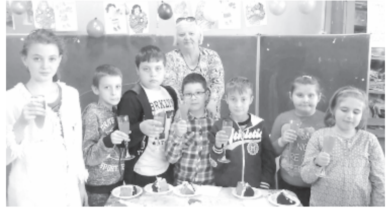
Egy utolsó koccintás

Utolsó kirándulásom volt a szülőfalum gyerekeivel és azok szüleiivel. Köszönet a polgármesteri hivatalnak az iskolabuszért.