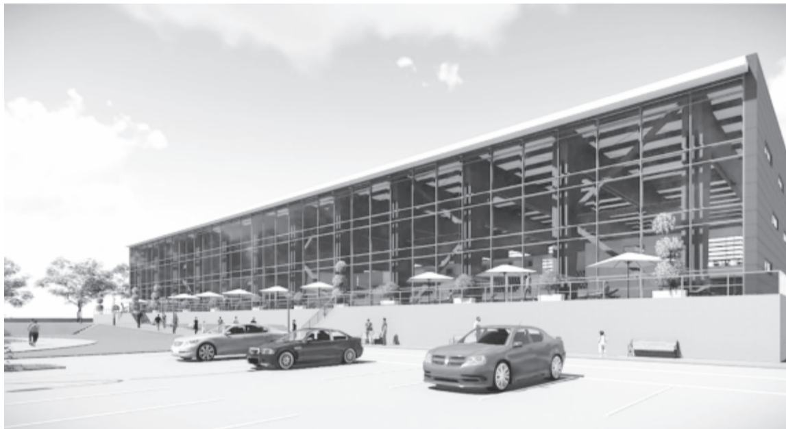
Az uszoda látványterve