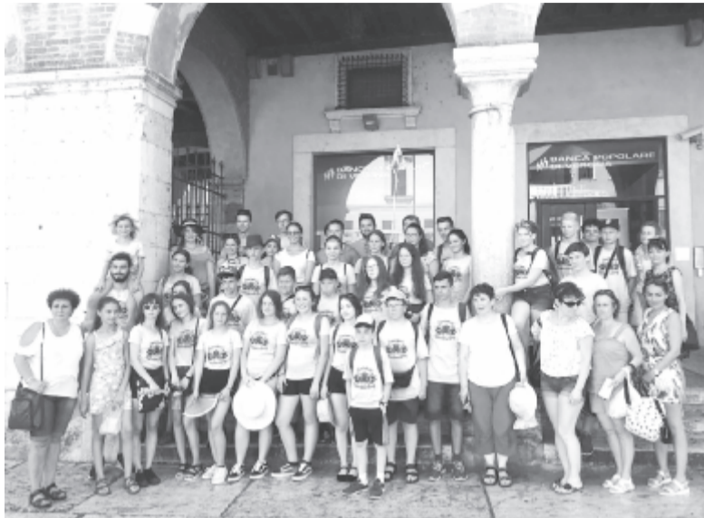
Nagyszerű teljesítményt nyújtott a gyulakutai együttes