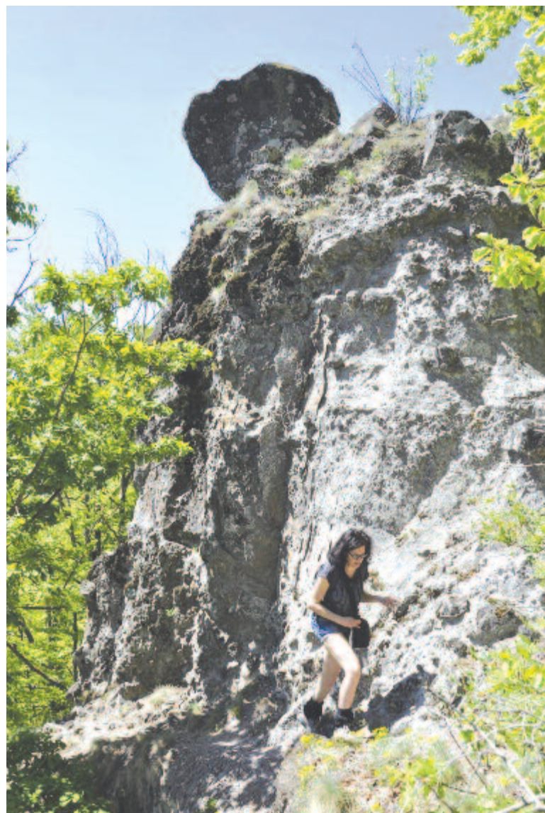
Útban a Rapsóné vára felé