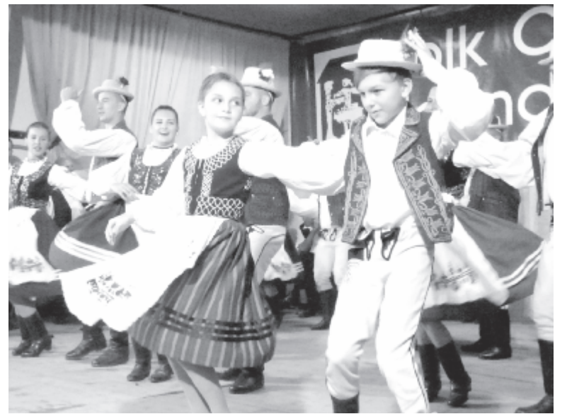
Nagy sikert aratott a Szépszivárvány együttes minden évben hazatér a tánc-tábor idejére.