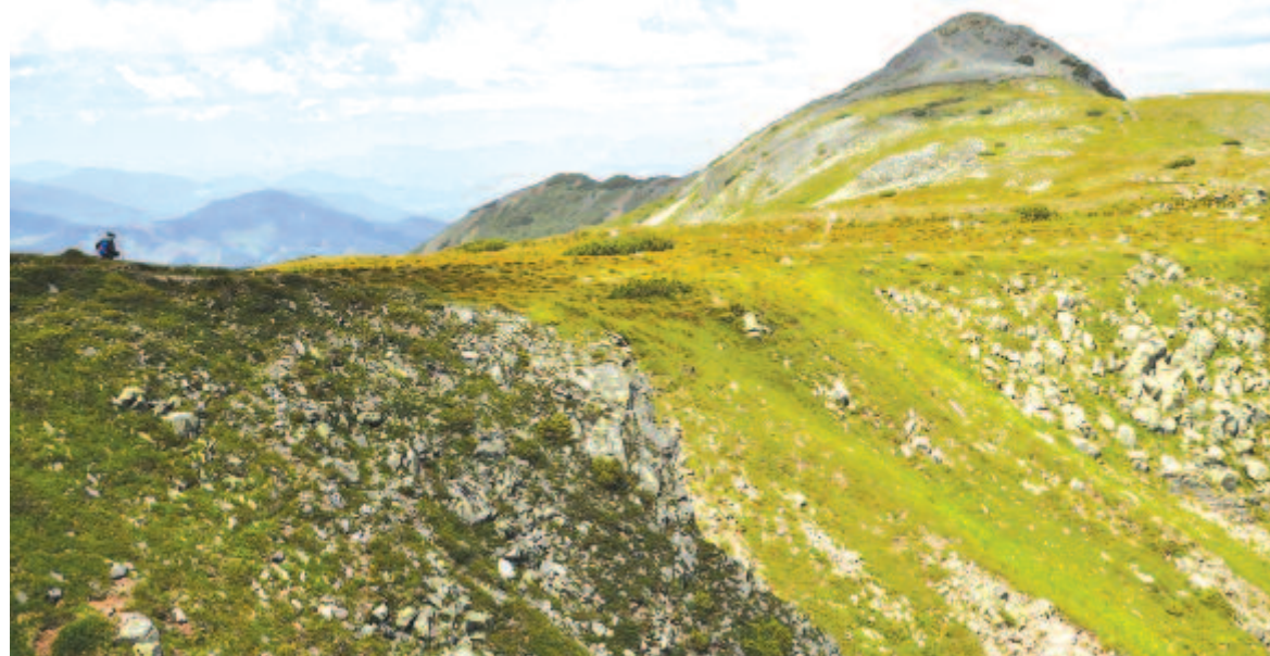
A Pietros gúlája