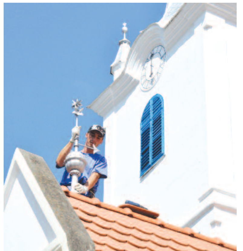
Helyére került a tetőrész is