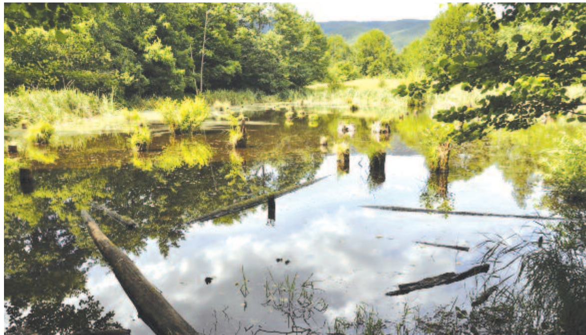
Az Égerfás-tó Vármezőn