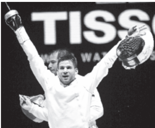
Siklósi Gergely, miután győzött az orosz Szergej Bida ellen a vívó-világbajnokság férfi párbajtőr-versenyének döntőjében a budapesti BOK Csarnokban 2019. július 19-én.

A mostani diadalt megelőzően 2015-ben volt párbajtőrben magyar aranyérmes, akkor Imre Géza győzött Moszkvában.