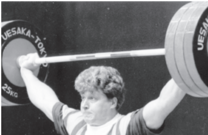
A minden idők legjobb román súlyemelőjének tekintett Nicu Vlad szövetségi elnökként a sportág itteni fellendülését várja a rendezvénytől

Az U17-es lány és fiú országos ifjúsági súlyemelő-bajnokság kedden kezdődött a ligeti sportcsarnokban, 147 versenyző (közülük 62 lány és 85 fiú) részvételével, és július 19-én zárul.