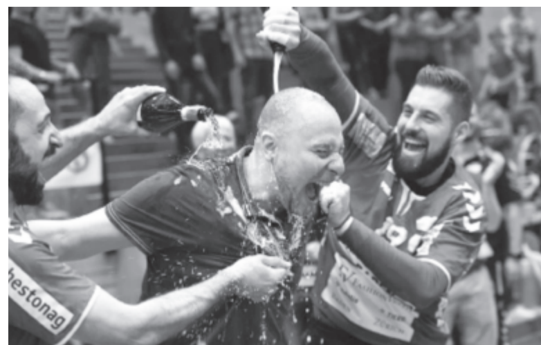
Az öröm pillanatai

Az összetett élcsoportha: 1. Julian Alaphilippe (francia, Deceuninck – Quick-Step) 43:27:15 óra, 2. Geraint Thomas (brit, Ineos) 1:12 perc hátrány, 3. Egan Bernal (kolumbiai, Ineos) 1:16 p h.