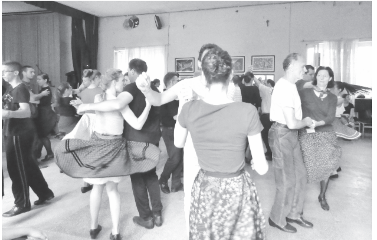
Kicsik és nagyok tanulják a muzsikálást vagy ropják a táncot egy héten át

Olyan világban élünk, amikor nincs időnk egymásra, amikor egyre kevesebben vannak azok, akik összefogják a közösséget, akik próbálják egymásnak átadni a legjobbat. Ez a tánc tábor annak példája, hogy mégis léteznek ilyen emberek, hiszen itt mindenki ugyanazért a célért van: megmutatni, hogy él még az őseinktől kapott érték, a hagyomány, a népzene és néptánc – mondta tábornító beszédében Barabási Ottó polgármester.