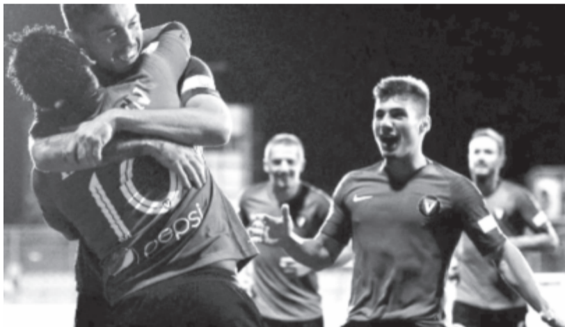
Ötször ünnepelhettek a Viitorul játékosai a Dinamo elleni mérkőzésen.

algériai labdarúgó-válogatottak az Egyiptomban zajló Afrikai Nemzetek Kupája elődöntőjében aratott győzelme utáni ünneplést követő incidensek során. A francia nagyvárosokban utcára vonult és hatalmas ünneplésben tört ki vasárnap este több ezer algériai és kettős állampolgárságú francia-algériai szurkoló, miután az algériai labdarúgó-válogatott az elődöntőben 2-1-re legyőzte a nigériai csapatot. A reggelig tartó ünneplés azonban helyenként összecsapásokba torkollott a rendőrökkel Párizsban, Lyonban és Marseille-ben, sok helyen a szurkolók tüzet gyújtottak, amely szemetekre és gépkocsikra is áterjedt. A francia belügyminisztérium hétfői közlése szerint országsszerte 282 embert állítottak elő, közülük 249-en kerültek őrizetbe.