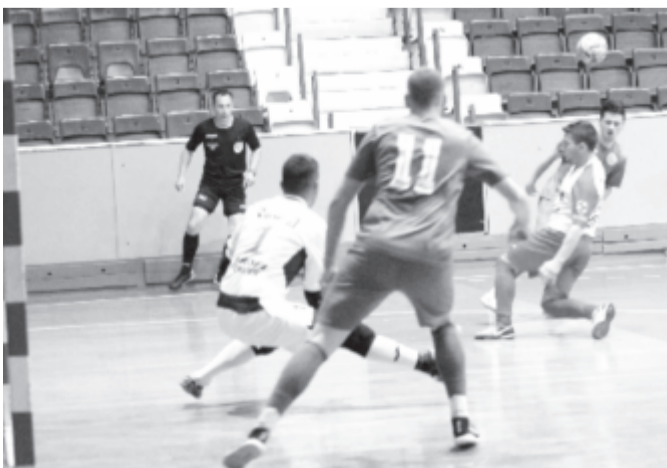
Az ősztől kötelező lesz egy 23 év alatti, román állampolgárságú játékos szerepeltetése állandó jelleggel a mérkőzések folyamán.

Igaz, a nagypályás fociban is van korhatáros játékosokra vonatkozó szabály, ott azonban a tíz mellett van egy tizenegyedik, akit így könnyebben segíthetnek a tapasztaltabbak, a teremfociban azonban, amennyiben a négy mezőnyjátékos között van egy gyengébb, a többiek szintjétől elmaradó láncszem, annak azonnali negatív következményei lehetnek, hiszen minden labdavesztés potenciális gólhelyzet az ellenfélnek. Továbbá a teremlabdarúgásban évekig hanyagolták a fiatalok nevelését, gyakorlatilag a nagypályán plafonálódott, átszábitott focisták tanultak bele már felnőttként ebbe a gyökeresen különböző műfajba. Először Marosvásárhelyen, majd Székelyudvarhelyen kezdtek kifejezetten teremfocistákat nevelni már ifjúsági korban, máshol csak szórványosan, így sikerült például a CSM-nek a City'ustól megörökölt fiatalokkal megnyerni a 2. ligát. Most viszont, hogy a fiatalok használata kötelezővé vált, minden keretben három,