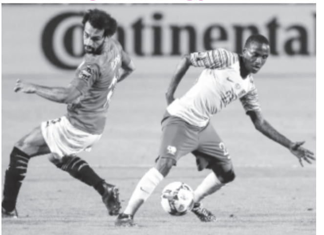
Lorch (j) és Szalah csatája – a végén a dél-afrikai örülhetett.

A címvédő Kamerun után a házigazda Egyiptom is kiesett a labdarúgó Afrikai Nemzetek Kupájáról: a nyolcaddöntő szombati játéknapjának estjén az egyiptomiak 1-0-ra kikaptak Dél-Afrikától, amely a legjobb nyolc között Nigériával találkozik.