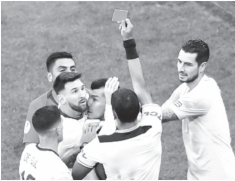
Lionel Messi nem értette, miért állítják ki.

A túlóldalt Chile megkapta az esélyt, hogy megszakítsa története eddigi leg-hosszabb góltalansági sorozatát a Copa Américán (három meccse volt gólképtelen, erre 1922 óta nem volt példa), és Vidal élt is az eséllyel, értékesítve a VAR-oszást után megítélt tizenegyest (2-1). Mindez azonban csak szépségtapas volt, a