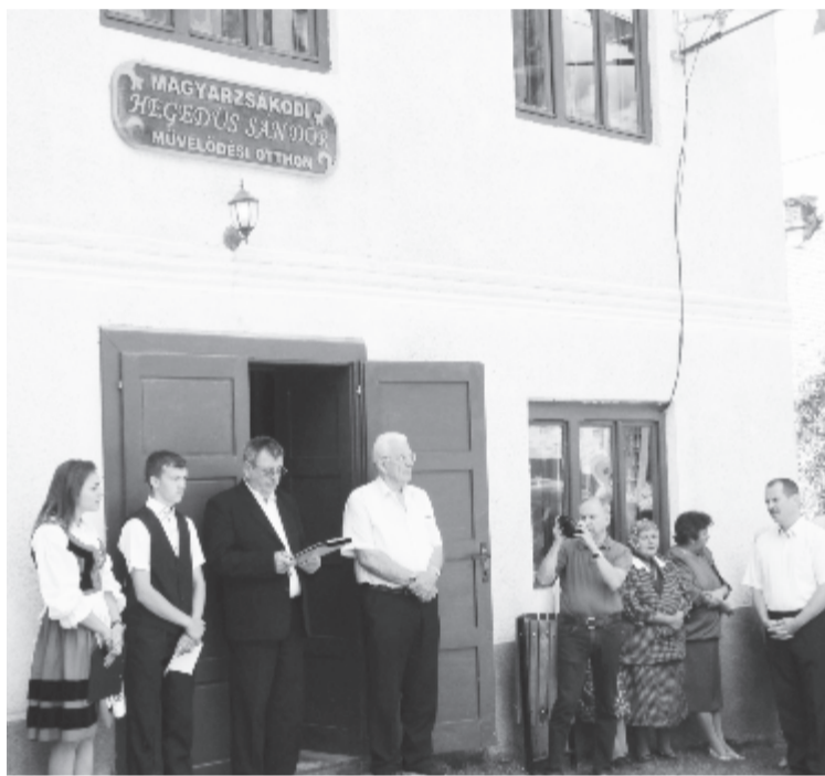
A búcsúünnep jó alkalom volt a névtábla leleplezésére is

Szentséges volt Mária és Erzsébet találkozás, de az elszármazottaké is. Isten azért ajándékozott meg ezzel az ünnepel, hogy üzenjünk, amit az elszármazottak magukkal visznek, és ami erőt ad nekik a mindennapokhoz – hangoztatta Balázs Sándor unitárius lelkész a művelődési otthon névadására összegyűlt előtt. Magyarzsákokodnak nem kell hangzatos nevet „importálni”, hogy intézményeit elnevezhesse, hiszen Isten megáldotta e falut egy nagynevű férfival, akiben sok-sok tehetség és nagy munkabírás párosult, és aki töretlenül ragaszkodott a faluhoz, előnévként hordozta a nevét. A névtábla mindenkit a lelkiismeretességre kötelez és arra, hogy a tisztséget nemcsak elérni kell, hanem teljes