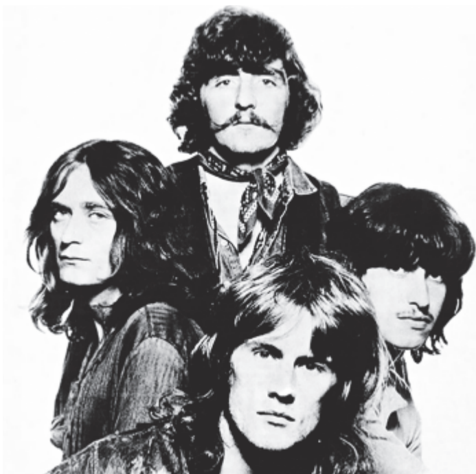
A Ten Years After