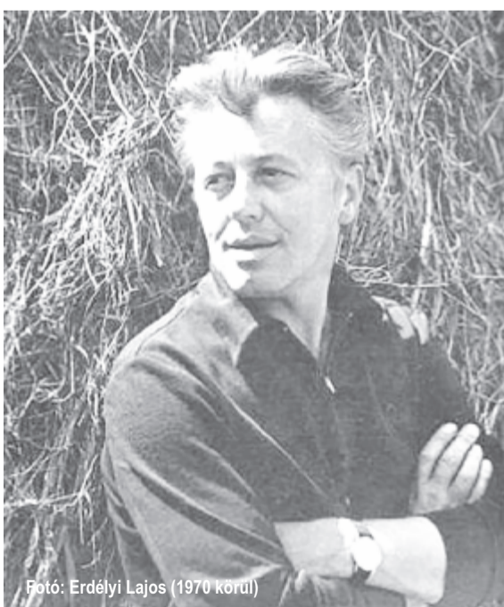
(1970 körül)

– Szívesen vettem részt a Sütő András Baráti Egyesület munkájában, de csak egyike vagyok azoknak, akik ezt az estet létrehozták. Az egyesület minden évben megszervezi, koszorúznak is a temetőben. Sütő András egy 1976-ban, Nádor Tamásnak adott interjújában azt mondta: „Az arcunkat nem szabad elveszítenünk”. Ki gondolta volna harminc