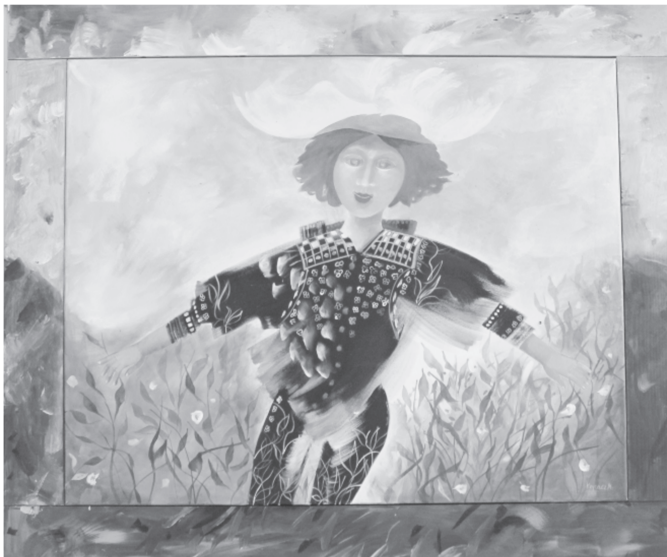
Kopacz Mária festménye

Egy éve, 2018. június 20-án, 89 éves korában hunyt el a Kossuth-díjas költő, a kortárs magyar költészet egyik legnagyobb alakja, a nemzet művésze.