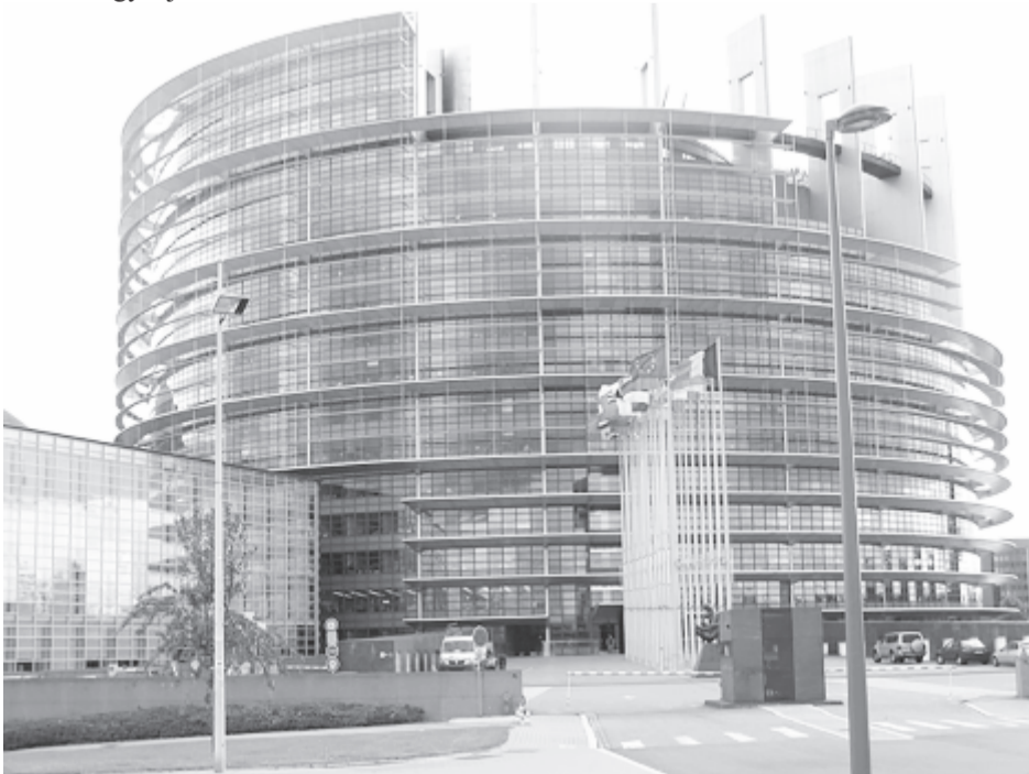
Fotó: EP-Strasbourg, Wikipédia

(Forrás: az Európai Parlament Magyarországi Kapcsolattartó Irodája)