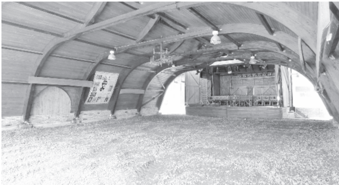
A Csűrszínház padlózatát napokon belül lebetonozzák