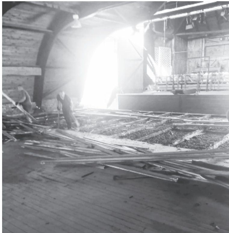
Zajlanak a munkálatok a Csúrszínházban

– Mennyire befolyásolja mindez a hamarosan kezdődő Csúrszínházi Napokat?