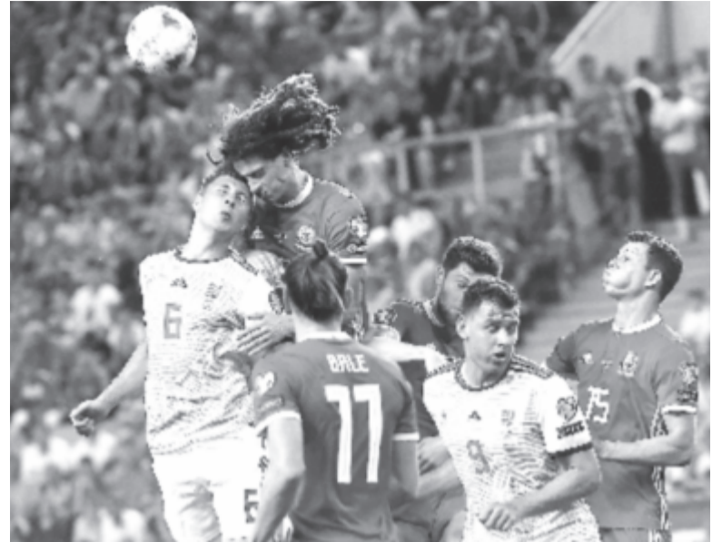
Willi Orbán (b), Szalai Ádám (j2), valamint a walesi Ethan Ampadu (b2), Gareth Bale (b3), Ben Davies (j3) és James Lawrence (j).

* J csoport: Liechtenstein – Finnország 0-2, Olaszország – Bosznia-Hercegovina 2-1, Görögország – Örményország 2-3; az állás: 1. Olaszország 12 pont/4 mérkőzés, 2. Finnország 9/4, 3. Örményország 6/4, 4. Görögország 4/4, 5. Bosznia-Hercegovina 4/4, 6. Liechtenstein 0/4.