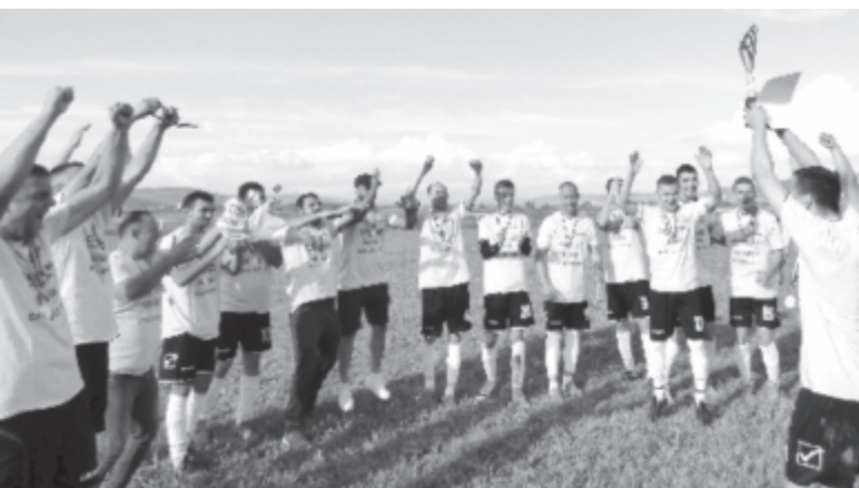
Harasztkerék sorozatban a negyedik bajnoki címet szerezte meg.