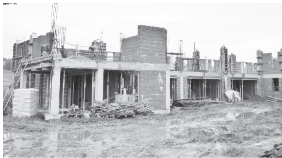
Folyik a munka, még közel egy év van az átadási határidőig

A nagyon várt építkezés a sportterem melletti területen folyik, így a kisiskolásokat és óvodásokat végre csendes, biztonságos helyre tudják majd költöztetni, ahol parkolóhelyek és játszótér is van, és nem kell többé a közúti forgalom miatt zajos, szennyezett és veszélyes helyen tanulniuk. A kisiskolásokat már tavaly elköltöztették a régi iskolából, egy kissé zsúfoltan ugyan, de az új általános iskolában tanulhattak, az óvodások viszont továbbra is a nemzetközi út mellett maradtak. (gligor)