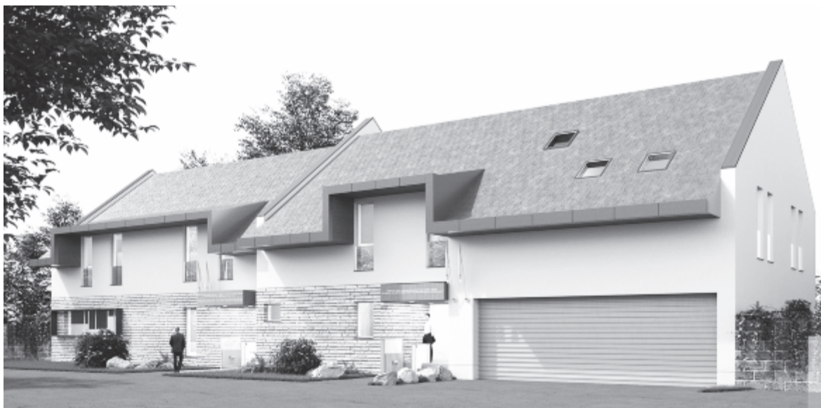
Az új székház látványterve

A Maros Megyei Hegyimentő Szolgálat idej tervei között szerepel két menedékház felállítása a Görgényi-havasokban, erre támogatást kaptak a megyei önkormányzattól. Mint ismeretes, nemrég négy védőkunyhót helyeztek ki a Kelemen-havasokba, és egy munkapontot az Istenszékére, ez utóbbi csak akkor van nyitva, amikor a hegyimentők ott szolgálatot teljesítenek, általában szombat-vasárnap, amikor a legtöbb turista fordul meg ott.