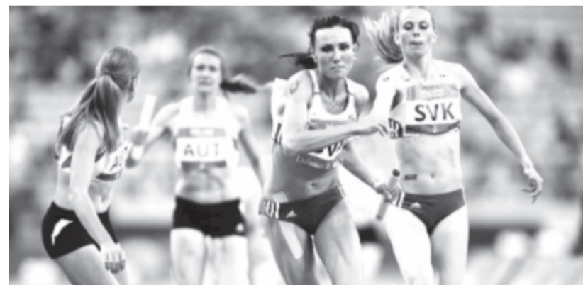
Váltóverseny az Azerbajdzsánban rendezett I. Európa Játékokon, 2015-ben.

A DNA küzdelmeit június 23-28-án rendezik meg a II. Európa Játékokon.