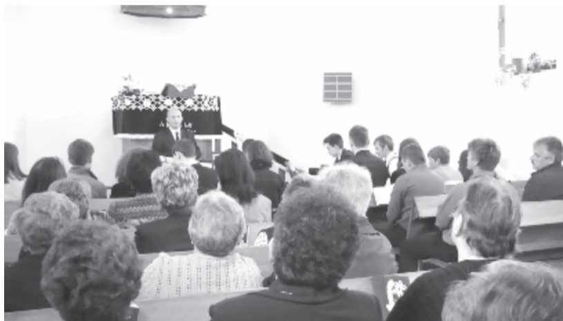
A gyülekezetek örömmel fogadták az újszerű eseményt