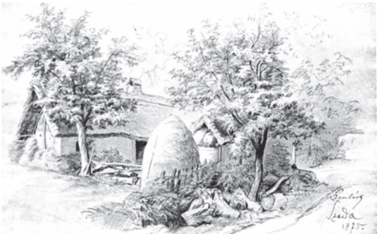
Szemlér Mihály: Falurészlet Szadán. 1904-ben, 115 éve hunyt el a festőművész, grafikus (született 1833-ban)

emléke mint megavult vászon lefoszlik rólam kitakar fázom