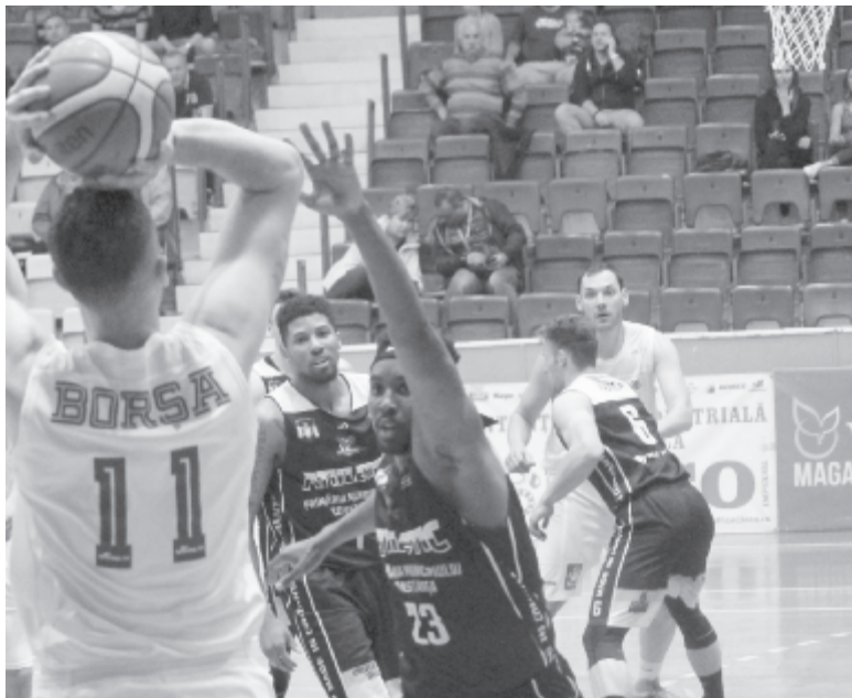
Az egy korábbi mérkőzésen lencsevégre kapott Borsza Voluntari-on 12 pontig jutott.

A harmadik negyedben azonban érvényesült a voluntari-i keret idegenlégiósainak ereje, Tasić és Mar-