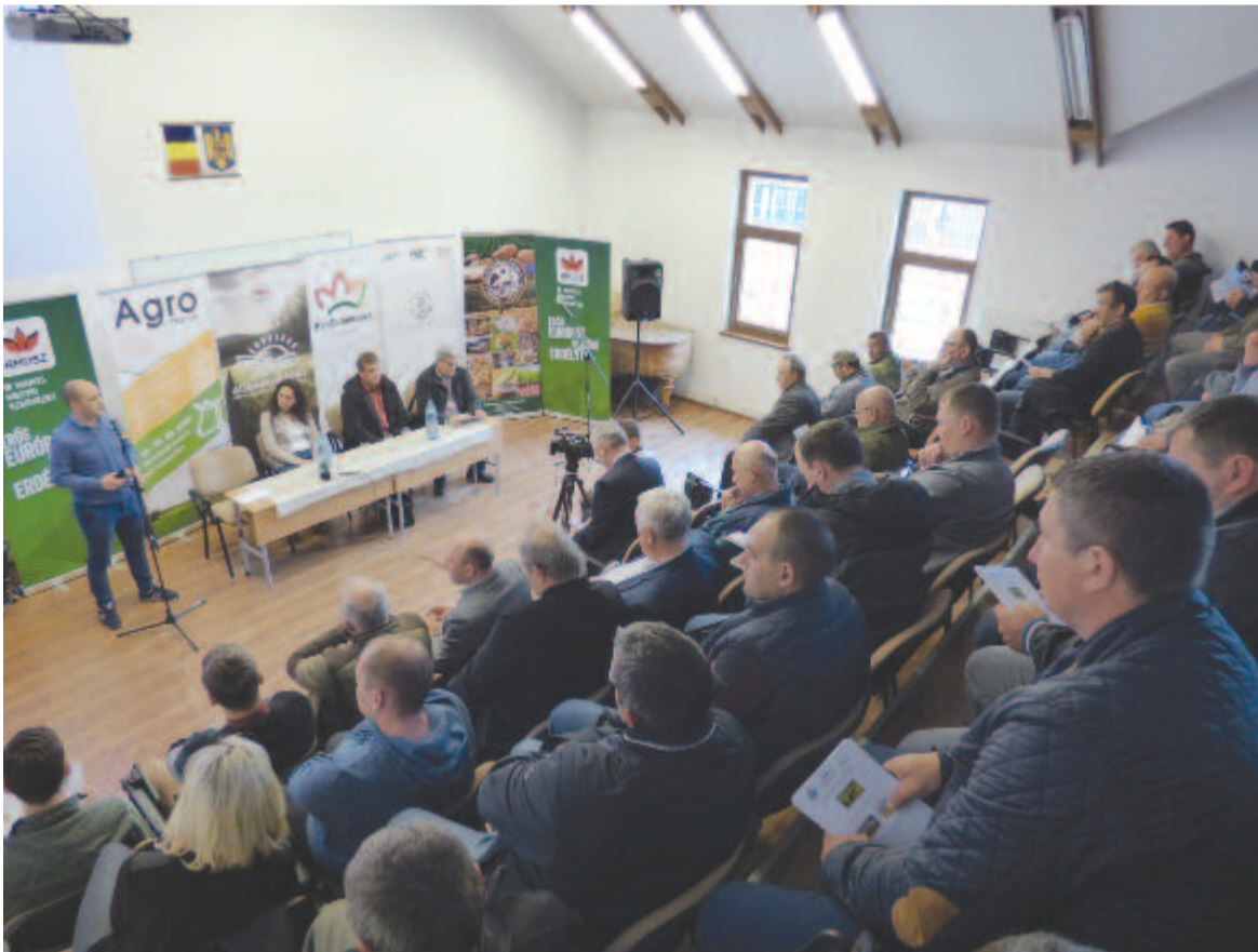
Szépszámú résztvevő hallgatta végig az előadásokat