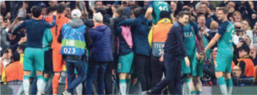
A londoniakkal pár perc alatt nagyot fordult a világ.

A finálét a madridi Wanda Metropolitano stadionban játsszák június elsején.