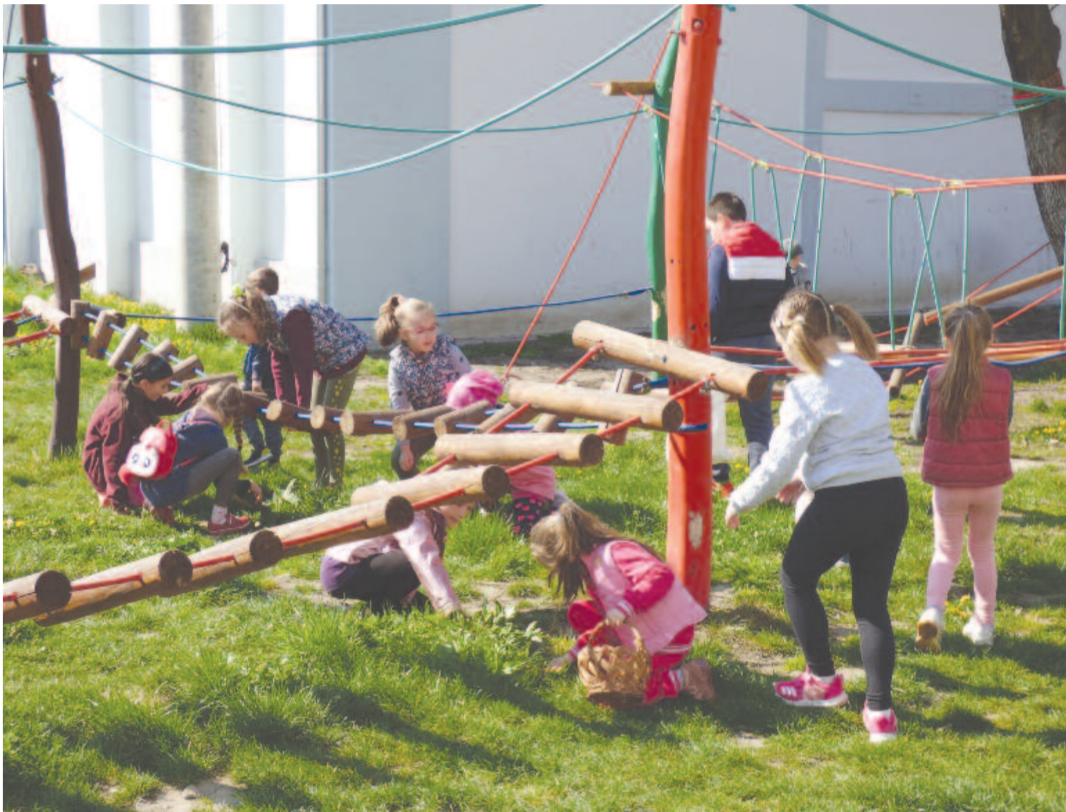
A gyermekek izgatottan keresték az elrejtett tojásokat