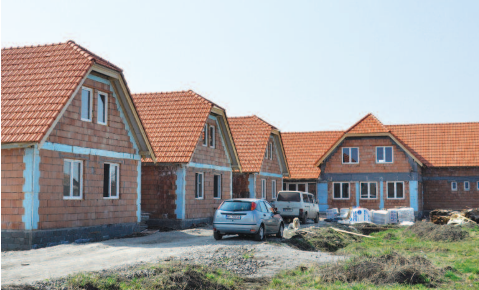
Magyarói vendégoldalunk a 6. oldalon