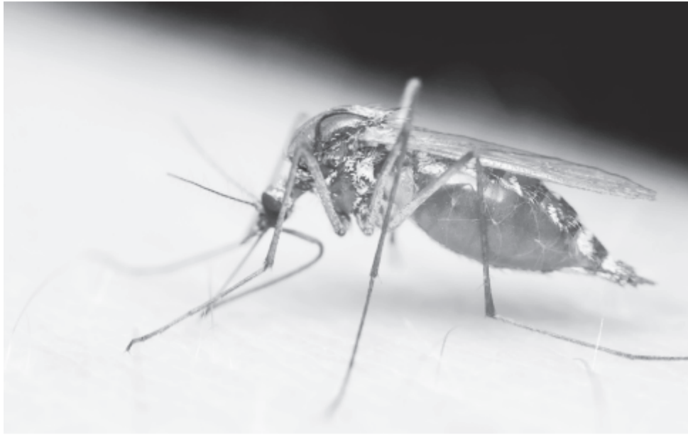
A kép illusztráció.

A Dirofilaria -fajok okozta fonálféreg-fertőzések javát Európában a Dirofilaria immitis és a Dirofilaria repens fajok idézik elő. A kontinensen a szív- és a bőrférgesség évtizedeken át csak a mediterrán övezetben, illetve a keleti térségben volt kimutatható, frissebb kutatások azonban arra utalnak, hogy a két élősködő Közép-Európában is teret hódít. A fonálféreg jelenlétét Romániában körülbelül tíz éve mutatták ki, azóta számos hásvő élősködőt. A szívférgességet okozó Dirofilaria immitis a tüdőartériát és a jobb szívkamrát támadja meg, súlyos klinikai tüneteket idézve elő kutyáknál. A Dirofilaria repens a bőrférgességet okozhatja, ami akár az emberre is