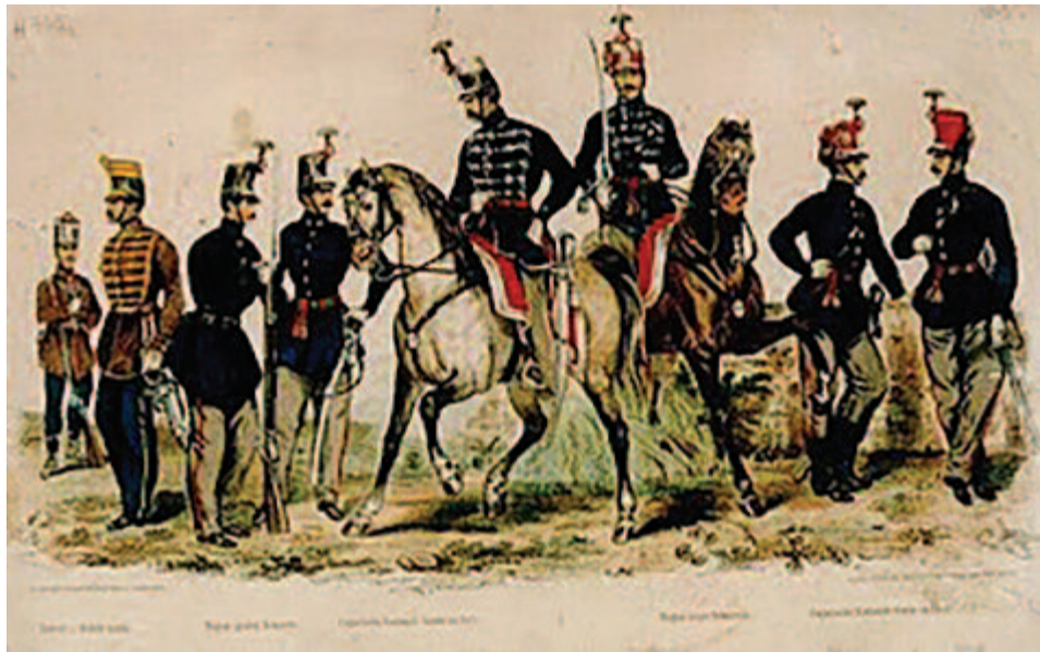
Korabeli nyomtatvány a nemzetőrség viseletéről

Kolozsi Jánosra mint gazdálkodó emberre is föltekintett az 1187 lelket számláló katolikus közösség, melynek legnépesebbje a kerelőszentpáli volt, mely 600 lelket számlált, a besenyői 325-öt, a marosugrai pedig 116-ot. 15 Ezek a falvak Küküllő vármegye középső kerületének radnói (Kerelőszentpál, Ugra) és teremei (Búzásbesenyő) járásához tartoztak. A vármegye székhelye az 1207 lelket számláló Dicsőségmenton volt, melynek 656 magyar, 412 román, 2 német, 123 cigány és 137 egyéb nemzetiségű lakosa volt. 16 A román és szász többségű vármegyében – mivel a szászok és a románok is hűséget esküdtek az osztrák uralomra és császárra – szembeszálltak nemcsak a magyar forradalommal, hanem az osztrák uralom elleni magyar szabadságharcral is. A románok a legnagyobb zsarnok