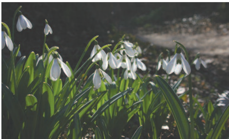
Tavasz virága. Tisztaság virága. A köszönet virága

2011 óta választják meg az év vadvirágát. Idén a magyar zergevirág ( Doronicum hun- garicum ) a szavazatok 47%-ával utasította maga mögé a tündérfátyolt és a macskaherét. A zergevirág nemzetség fajtái – nevékhöz méltóan – valóban sziklaszirtek, hasadékok, száraz, nyílt tölgyes erdőszegélyek növényei. De kerti dísznövényként is találkozhatunk velük. Növé- nyünk a Kárpát-medencén kívül a Balkán-fél- sziget keleti felén is lehet. Áprilisban már előjönnek a magyar zergevirág jellegzetes töle- velei, majd hamarosan nagy, sárga virágai is megjelennek. Május végére elvirágzik.