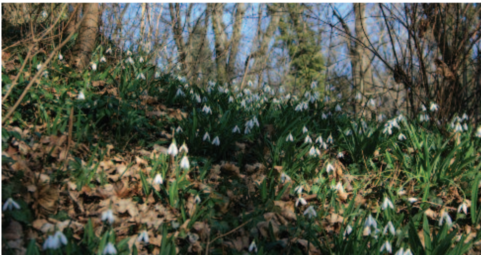
Hóvirágok – valahol – bárhol – a Kárpát-medencében

Köszönet neked, aki megszültél. És neked, aki a feleségem voltál – írom ide Márai Sándor Füveskönyvéből e sorokat –, És neked, te harmadik, tizedik, ezredik, aki adtál egy mosolyt, gyöngédséget, egy meleg pillantást, az utcán, elmenőben, vigasztaltál, mikor ma- gányos voltam, elringattál, mikor a haláltól féltem. Köszönet neked, mert szőke voltál. És neked, mert fehér voltál. És neked, mert a kezed szép volt. És neked, mert ostoba és jó voltál. És neked, mert okos és jókedvű voltál.