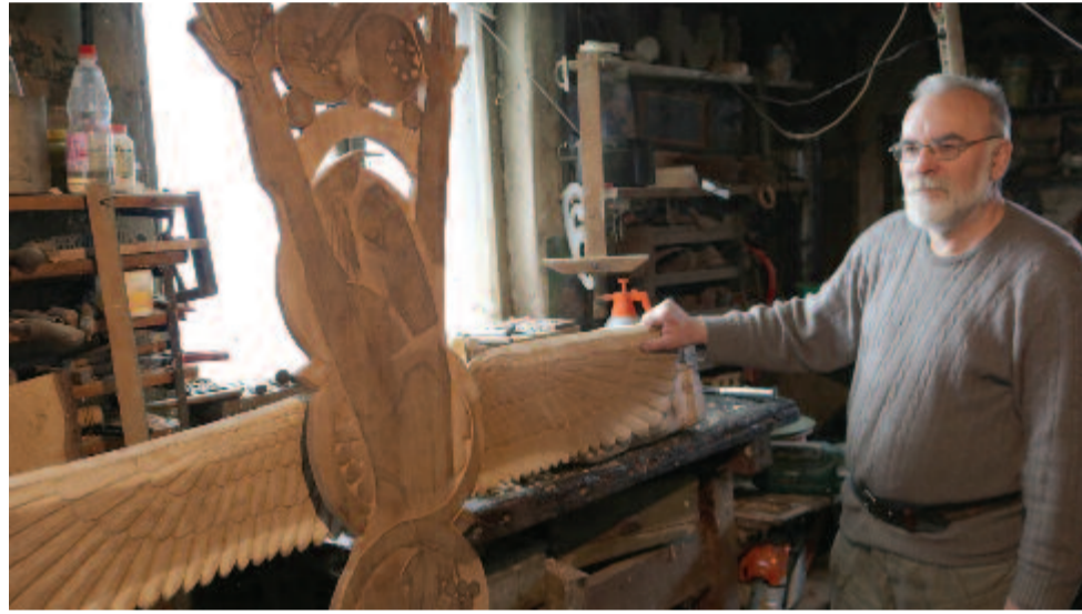
A feltámadó Jézus

– Nagyon szerettem a természetet és az állatokat, állatorvosnak készültem. Tanulás