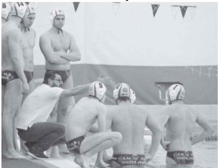
Tanácskozó marosvásárhelyiek: az első mérkőzést úgy nyerte meg a csapat Kolozsváron, hogy a képen éppen taktikai eligazítót tartó edzőjüket kiállították a játékosok.