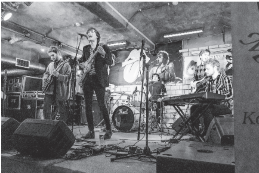
A Szintaxis együttes

A marosvásárhelyi döntő ismét jó hangulatú, nívós eseménynek bizonyult, és immár eldöntött tény: 2020. március 7-én harmadik alkalommal is sor kerül rá. A hagyomány megszületett. (Miklóssy)