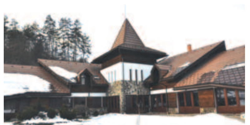
A Marosszéki Közirtokosság székháza

Az üzemtervekben megjelölt évi fakitermelési mennyiség 33.000 köbméter, aminek majdnem fele, mintegy 15.000 köbméter fővágás (felújító és tarvágás, illetve szélöntés). Ezenkívül 12.000–13.000 köbméter a gyéritésből és felújító vágásból származik, és van 1000 köbméter ún. konzerválási erdőirtás. Amennyiben az előirányzott mennyiségnél többet vágnak ki vihar esetén, az előző évben kitermelt mennyiséget leszámítják a következő évből. Tarsavos vágást 3 hektár alatti területen végeznek. Hat és nyolc éven belül újul meg természetes úton a kitermelt parcella. Az említett munkálatok függvényében ütemezik be az ültetéseket. Az erdőgazdálkodási törvény szerint két éven belül minden kivágott fa