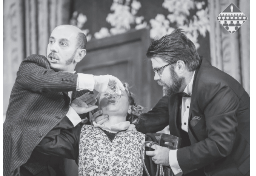
A láthatatlan hóhér