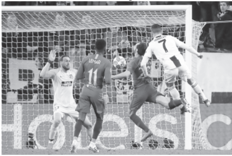
Cristiano Ronaldo megszerezte a torinói első gólját – végül háromig jutott, és beállította Lionel Messi csúcsát.

A legjobb nyolc mezőnyének már tagja a Manchester United, az Ajax, a Tottenham Hotspur és az FC Porto is.