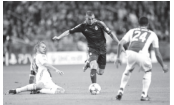
A holland klubnál úgy vélik, a hazai vereség ellenére van még némi esély a negyeddöntőbe kerülés kiharcolására, ami 2003 óta nem sikerült.

A klub jelezte, hogy kárpótolja azokat a bérleteseket, akik a hétközi mérkőzésre nem tudnak kilátogatni.