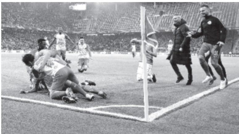
Négyet rúgott a Salzburg a Bruges-nek, simán kvalifikált az osztrák csapat.