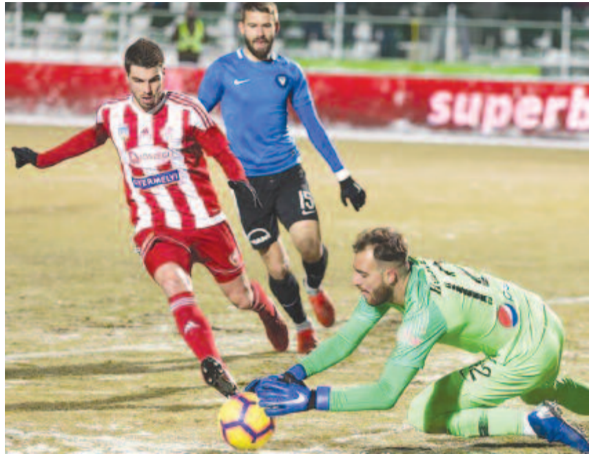
A rendkívül fizikális küzdelem a Viitorul labdarúgónak erejét örölte fel gyorsabban, egyórányi játék után védők rendre lemaradtak a szentgyörgyi támadókról.