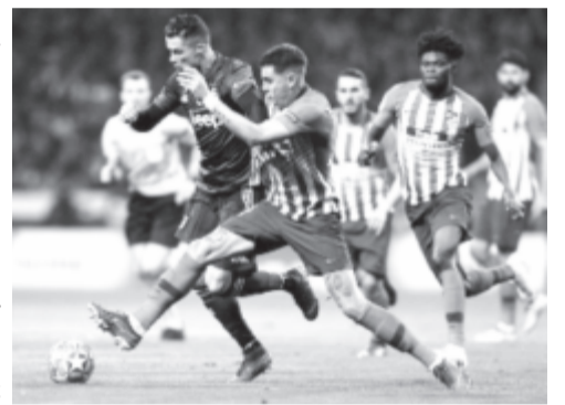
Rosszul sikerült a Juventus számára C. Ronaldo nagy erőklődéssel várt madridi vendégszereplése.