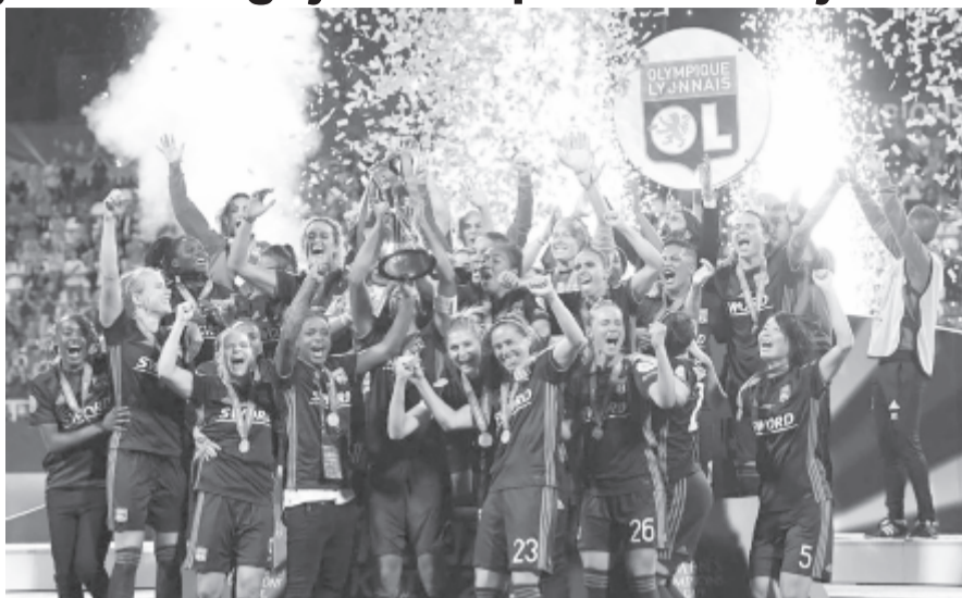
Tavaly Kijev volt a házigazda, a képen a hosszabbítás után a Wolfsburg ellen 4-1-re diadalmaskodó Lyon csapatának tagjai.

A női BL-döntőt május 18-án, 18 órai kezdettel rendezik a budapesti Groupama Arénában. A rendezvényre a szervezők 130 lelkes, elkötelezett, 18. életévét betöltött és angolul minimum kezdő társalgási szinten beszélő önkéntes jelentkezését várják, összesen 11 különböző feladatterületre (akkreditáció, ceremónia, transzport, VIP és protokoll, média, projektmenedzsment, jogvédelem, társadalmi felelősségvállalás és fenntarthatóság, szponzoráció, tévéközvetítés, önkéntesmenedzsment).