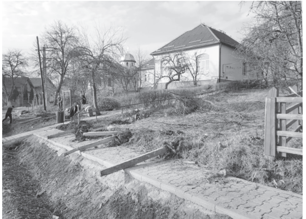
Hétfőn elkezdődtek a munkálatok, elsőként Agárdon bontják le a kerítést

A program keretében felújítják és felszerelik a községbeli iskolák udvarait, 240 gyerek számára biztosítanak táborozási lehetőséget, 157 óvodás gyereknek szerveznek kirándulást, 20 gyereknek és családjának nyújtanak támogatást ahhoz, hogy visszakérüljenek az iskolába, anyagilag is támogatják a veszélyeztetett réteget. A projekt kifizetési ideje 36 hónap, értéke pedig 5.345.972,76 lej (vissza nem térítendő támogatás).