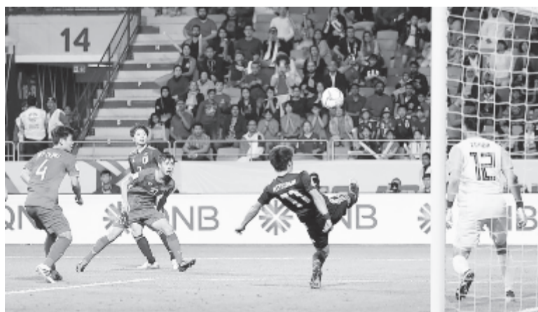
A japánok már a legjobb négy között.

A Japán – Irán mérkőzést ma 17 órától, a Katar – Arab Emírségek találkozót kedden 17 órától rendezik.