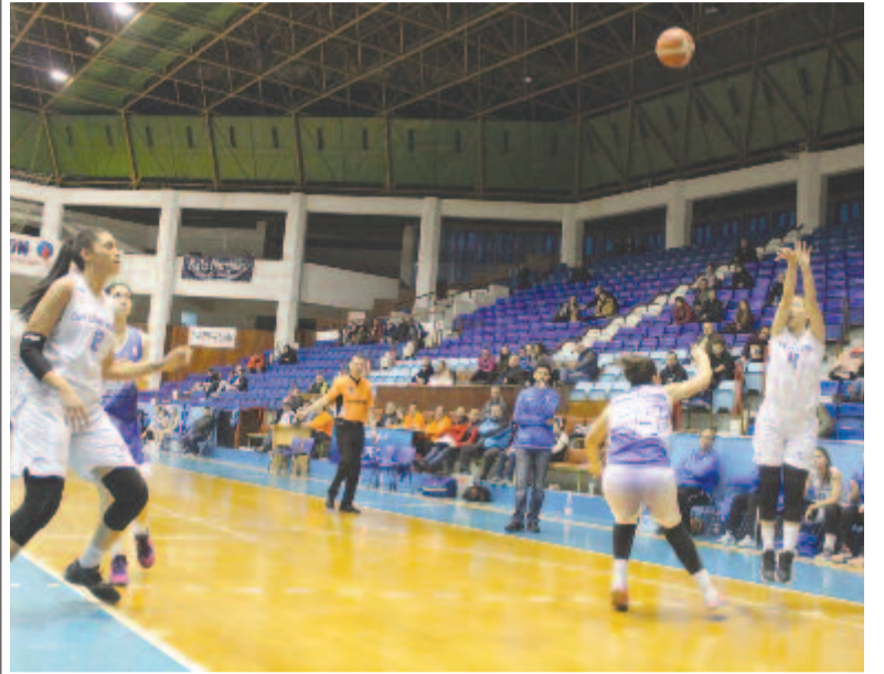
Sorban veri ellenfeleit a számára tét nélküli mérkőzéseken a marosvásárhelyi együttes