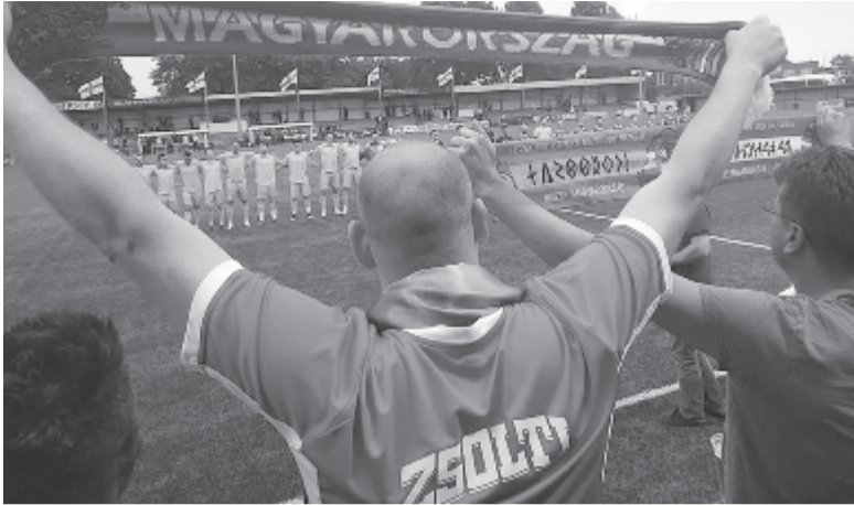
Tavaly a vb-elődöntőben összekerült Kárpátalja és Székelyföld válogatottja.

A június első felében megrendező Európa-bajnokságon tizenkét csapat harcol az első helyért: Kárpátalja mellett hiányzik majd a mezőnyből a legutóbbi Eb ezüstérmese, az Észak-ciprusi Török Köztársaság együttese is, amely valószínűleg az évszázados török-örmény konfliktus miatt nem vállalta, hogy örmény területen pályára lépjen (1915 és 1917 között az Oszmán Birodalomban történészek szerint mintegy másfél millió örményt telepítettek ki erőszakkal