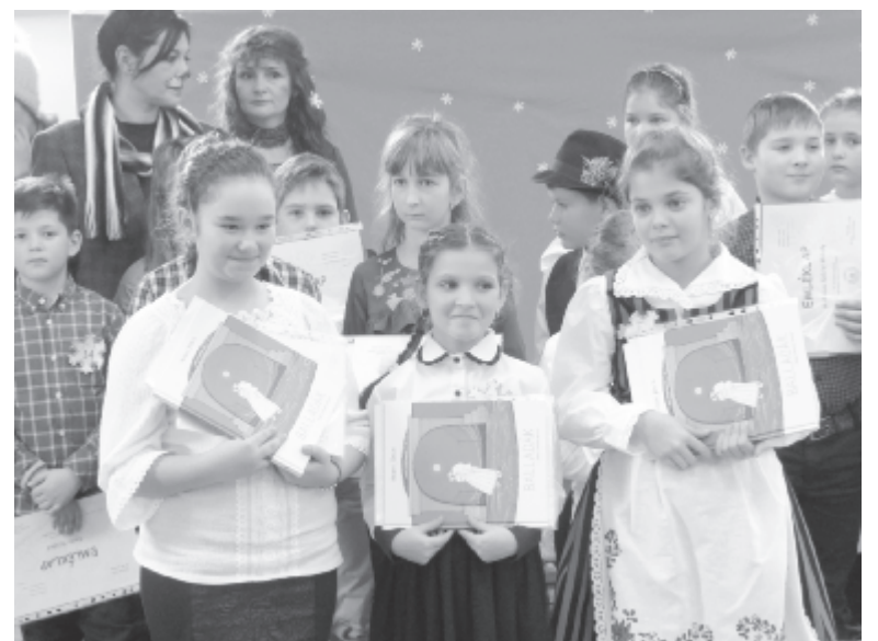
A körzetek legjobb szavalói jutottak tovább a megyei szakaszra