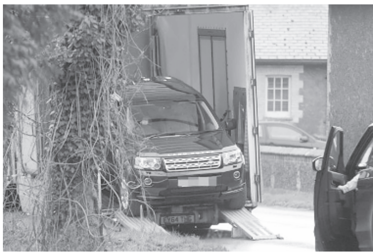
A balesetet követően egy másik Land Rovert kapott a herceg

Amikor Barack Obama volt amerikai elnök és felesége 2016 áprilisában hivatalos londoni látogatása során felkereste a királynőt és férjét a windsori királyi rezidencián, a parkban leszálló helikoptertől a kastélyig vezető úton az akkor 95 esztendő Fülöp vezette az uralkodót és az elnöki házaspárt szállító autót. (MTI)