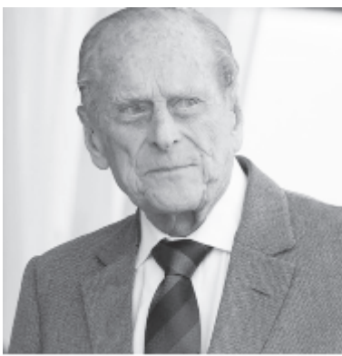
Fülöp herceg

nap Sandringhambe szállítottak egy másik Land Rovert a királyi család garázsából, és Fülöp azonnal ismét a volán mögé ült.