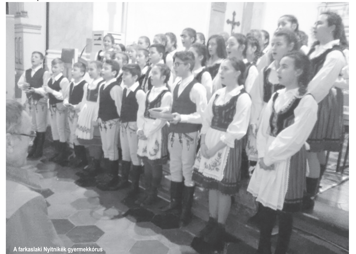
A farkaslaki Nyitnikék gyermekkórus

Ezután újabb gyermekcsoporthoz lépett fel: a szilágysomlyói Szederinda citeracsoport vallásos énekek mellett népdalcsoportot is bemutatott