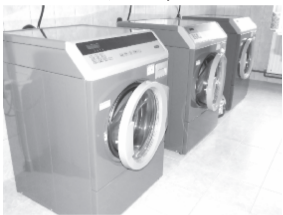
Beruházásra is jutott a tavaly: új fűkazánt és három ipari mosógépet vásároltak

Nyárádmagyaróson 2007 novemberében nyitott idősothton az önkormányzat, amikor egy pályázati beruházás révén az orvosi rendelő nagy, többnyire kihasználatlan épületét átalakította és kibővítette, majd európai finanszírozásnak köszönhetően tovább bővült az intézmény. 2011-ben egy új szárnyat adtak át, így a gondozottak száma a kezdeti tizenhatról negyvenre nőtt. 2017-ben sikerült megszüntetni az addigi áldatlan állapotot, hogy nem lehetett alkalmazni, a személyzet