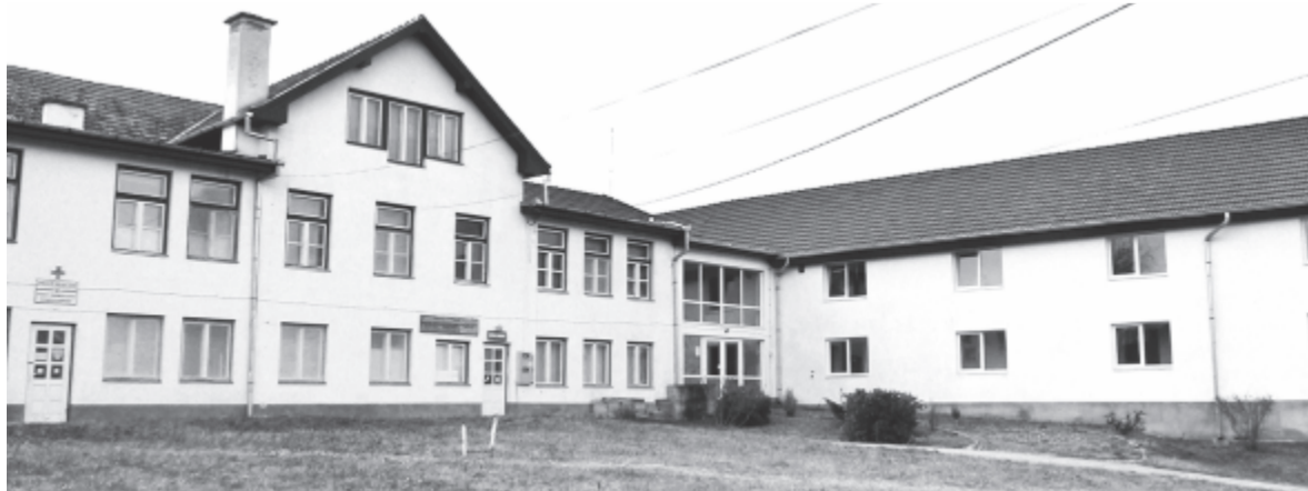
Az idősothton 2007-ben indult, 2011-ben új szárnyal bővült