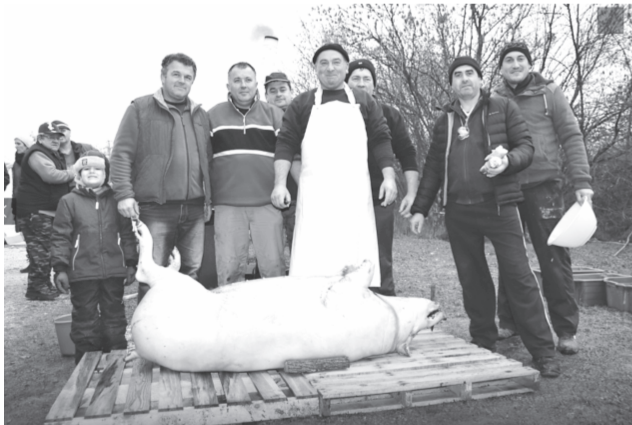
A gyulakutaiak a küküllőmenti hagyományok szerint dolgozták fel a disznót

Hasonló rendezvényeken más településeink is bemutatkoznak: a backamadarasiakat hagyományosan az abádszalóki böllérfesztiválra hívják meg nyárádminti disznótort készíteni, tavaly a makfalviak hívták meg disznóvágásra az anyaországi testvértelepüléseiket, míg Csíkfalva évek óta a Tolna megyei testvéreknél, Kakasdon vesz részt a hagyományos székely-sváb-magyar disznóvágáson. (gligor)