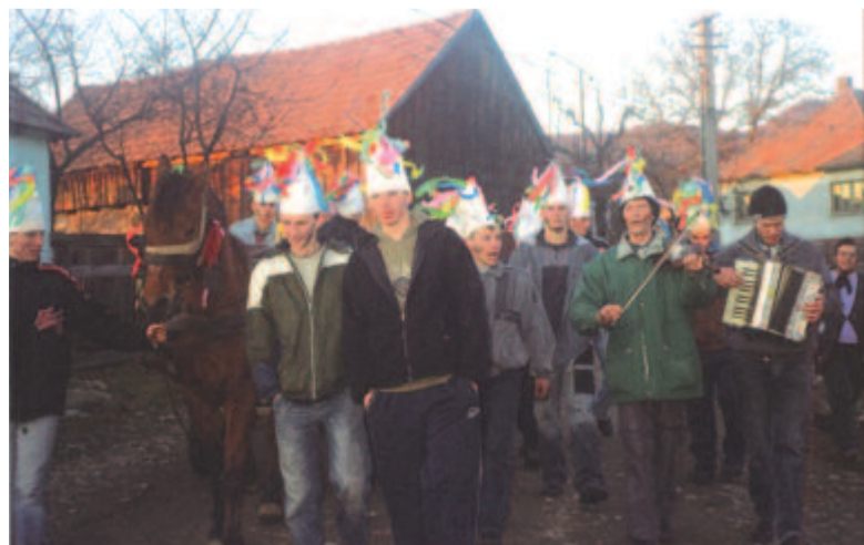
Indulnak a görgényüvegcsúri farsang végi „gyűjtőgetők” (2007)

hogy játékosvilágunknak csak ezt a táját érdemes időutazással felkies-rezni. Az esztendő ünnepi szokásai mellett végigjárhatnák az emberi életút játékos szokásainak hatalmas területét is, a gyermekjátékok birodalmába is bekukkanthatnának. Tegyük is meg következő alkalommal. Nekünk ennyire futotta, szerények a lehetőségeink. Nincs utazási és reklámirodánk, nem támogatták tervezett utazásainkat évekre szóló kutatási pályázatok, biztató megrendelések. Csak annyit mondhatok, megérte, hogy ezt a világot bejárjam, nem panaszkodhatom.