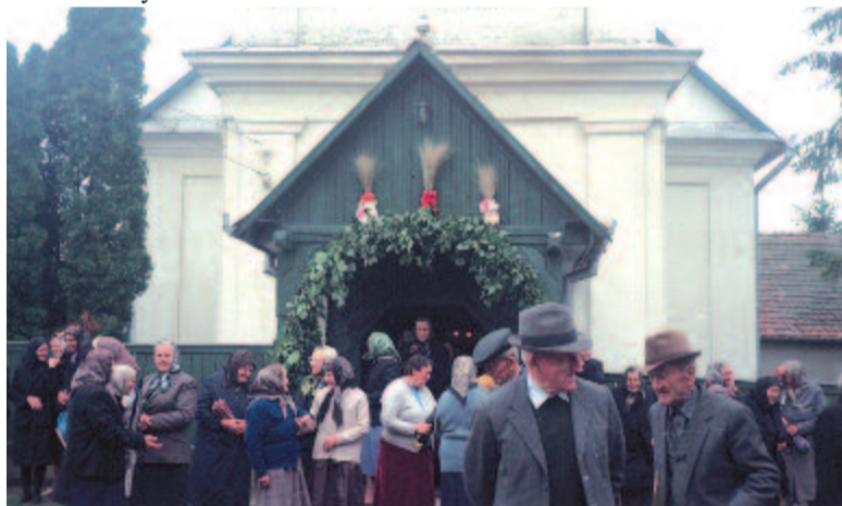
Pünkösdi lélekkel a feldíszített templom előtt (Csittszentiván, 2001)

azt is láthatjuk, hogy a fennkölt és a komikum, a szent és a profán nincsen szögesdróttal, de még kerítés-sel sem elválasztva, széles sávban érintkeznek, sőt egymásba játszanak. Mindkettőből és az érintkezési területekről is jól kimagasodik a hagyományban élő, játszó ember alakja. Hogy milyen az esendő ember, amikor Isten közelében szeret játszani és milyen, amikor távolabbra merészkedik vagy oda kényszerül, de még az isteni kegyelem határain belül jár-ke, botladozik. Egyik ünnepen szent színjátékban szertartásosan, ünnepélyesen, komolyan, pontosan szól és cselekszik, a másikon mókázik, bolondozva „úzi az esztét”, „fogja a figura”, mert ezt írja elő vagy megengedi a szokásrend forogatókönyve és a játékos világrend. Láthatjuk, ahogy belenő a játékos szokásokba és lelkesedik értük a gyermek. Hát még a legény és a leány: él-hal néhány percéért is. Az asszonyok a téli fonóbeli kacagóalakákban lelik örömeiket, a férfiak a farsangi maszkurázásban, az egykorúak, barátok az utcaszínházban, falufeljáró menetekben, a teljes közösség a húsvéti határkerülésben. Nemzedékek, korcsoportok színes sokasága vonul előttünk helyhez és időhöz kötöten: