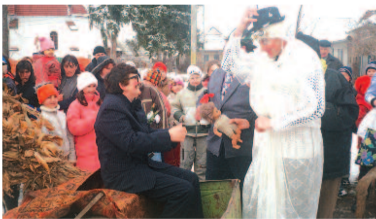
Utcaszínházi jelenet. Beresztelki farsangi menyasszony és völégény (2006)

lommal vagy elméleteket előrántva magyarázni jelenségeit, pedig lett volna mit bőven.