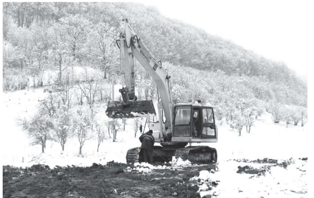
Január 17-én ismét munkához látott a kivitelező

A tervek szerint az Összetartozás temploma idén júliusra készül el, és az augusztus első szombatján tartandó bőzodújfalusi találkozón adják át.