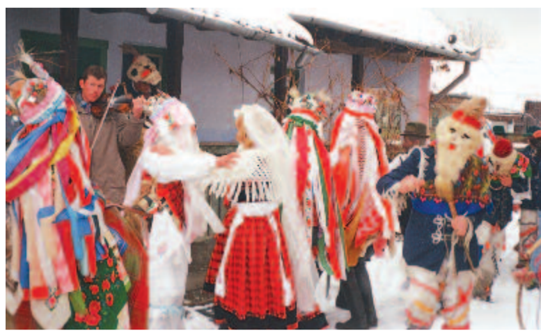
Színház a kapun belül. „Szépek” és ostorosok a kibédi farsangi játékban. (2000)

Mezőségen a hetvenes-nyolcvanas években, szóval és szemmel, kézzel és arcrándulással, amikor egy-egy játékos szokás elmaradásáról vagy betiltásáról kérdezősködtem, nagy baj lehet velünk, ha elveszítjük játékainkat, ha már nem tudunk vagy nem akarunk játszani. Mondom hát tovább nektek is, mai időutazó társak, nagy baj érhet, ha elveszítjük, levetkőzzük játszóemberi, homo ludens minőségünket, mert azután következik sorjában a többi: a kulturális és nemzeti azonosság, az anyanyelv