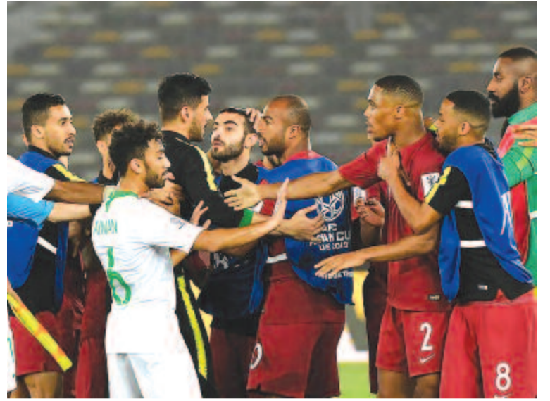
Nem mondhatni, hogy nyugodt meccs volt a Katar–Szaúd-Arábia közötti