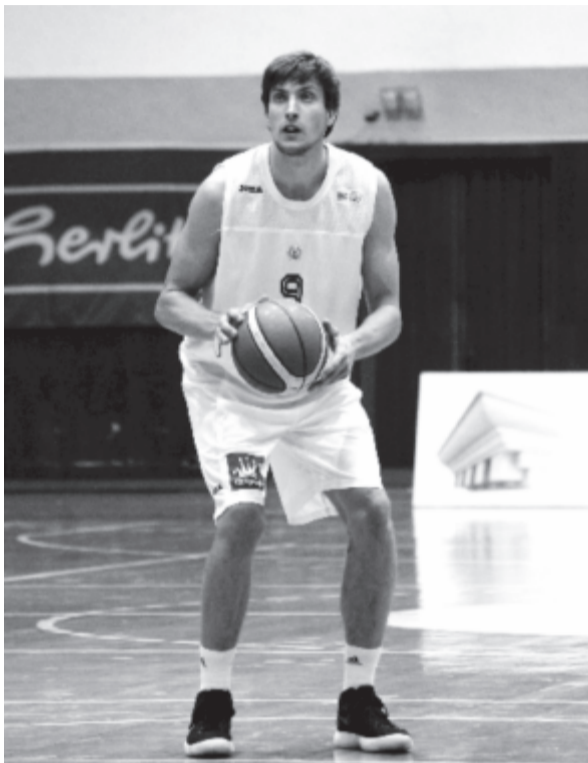
Kalve 16 ponttal járult hozzá a marosvásárhelyi sikerhez, amely ezúttal a várnál nehezebben született meg.

A Kék csoport 2. fordulójában a CSM a hét végén a Rapidot fogadja, másodsorra ebben a hónapban, hi-