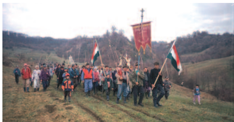
Érkeznek a határkerülők húsvét reggelén (Nyáradremete, 2000)