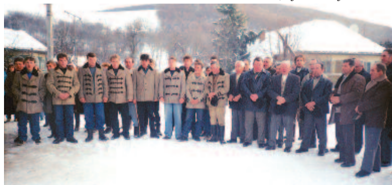
Szövérdi férfiak karácsonyi kántáló csapata (1998)