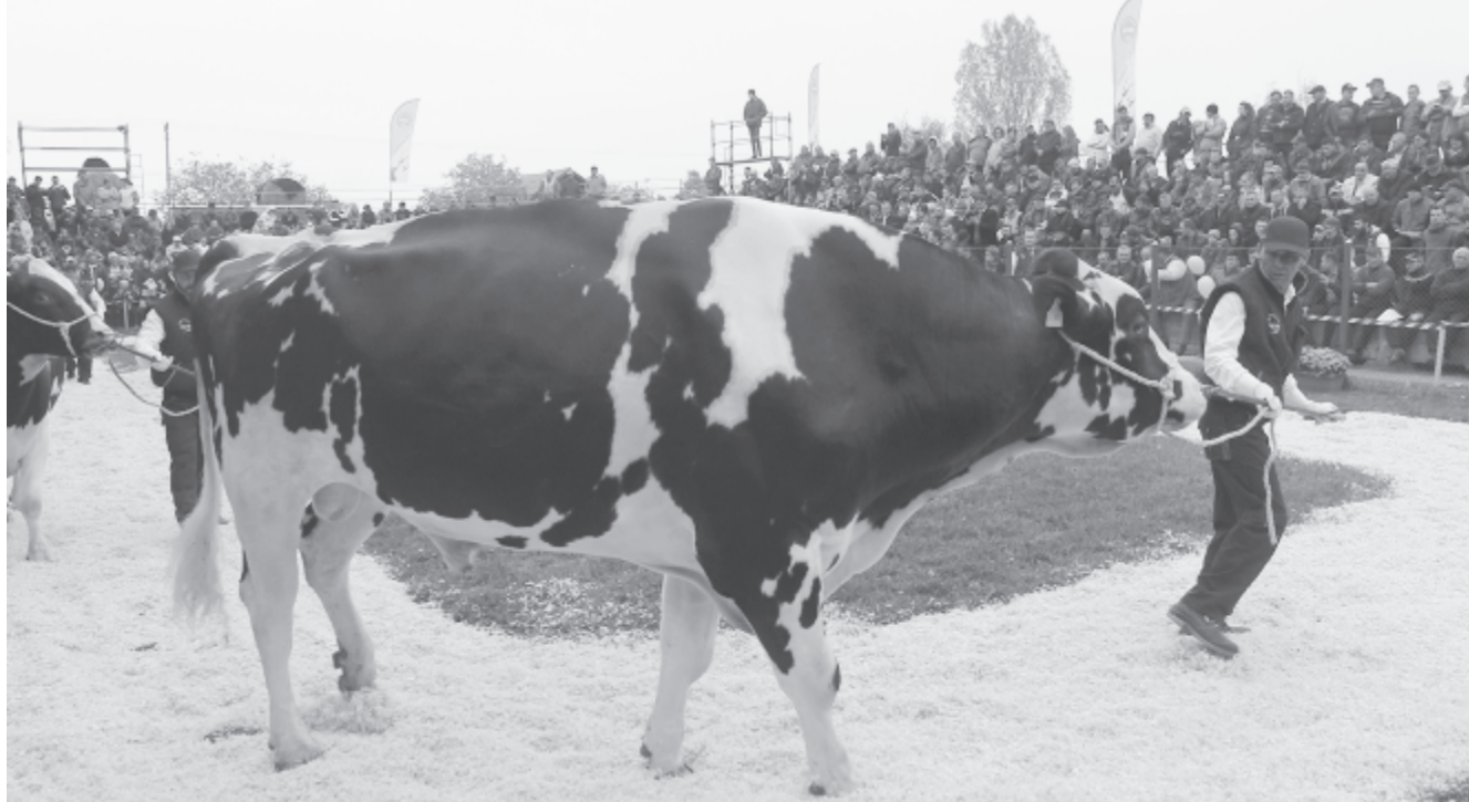
Tenyészbika-bemutató a maroszentgyörgyi SEMTEST BVN-nél

Az új jogszabályt a parlamenti szavazást követően az államelnöknek kell majd előterjesztenie, a Hivatalos Közlönyben való megjelenését követően válik jogerőssé. (vajda)