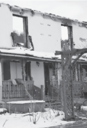
Remélik, hogy egy év múlva befedett, legalább részben helyreállított épületük lesz.