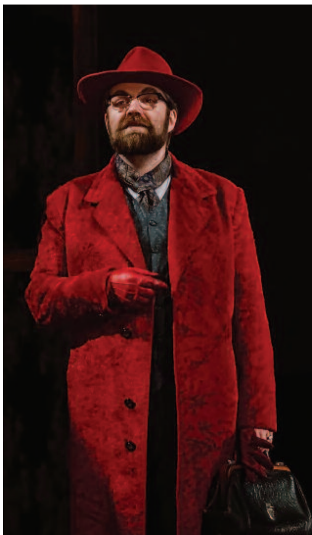
A láthatatlan hóhér

Közzétette 2018–2019-es, 74. évadának januári műsorrendjét a Marosvásárhelyi Nemzeti Színház Tompa Miklós Társulata. Eszerint 2019 első hónapjában láthatunk krimi, koprodukcióban készült drámai játékokat, kortárs drámát, komédiát, tragikomédiát, túlélőjátékokat, szatírákat, könnyes bohózatot és versösszeállítást, vásárhelyi produkciókat és vendégjátékokat egyaránt. A januári műsortervet az alábbiakban olvashatják.