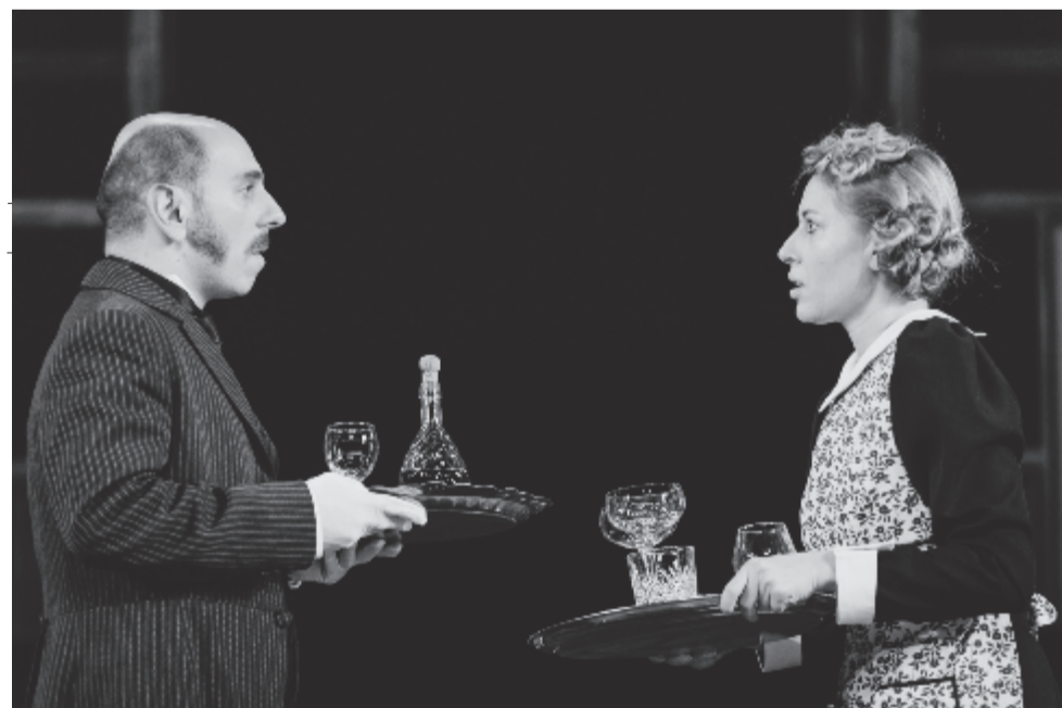
A láthatatlan hóhér

Amint azt a produkció ismertetőjében megjegyzik, Agatha Christie (1890–1976) a