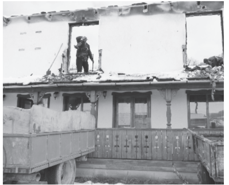
Az önsajnálattal helyett munkához láttak a szentimrei

lat szerint az épület alapja megbírja a terhelést, és lehet, hogy ehhez részleges falbontásra is szükség lesz.