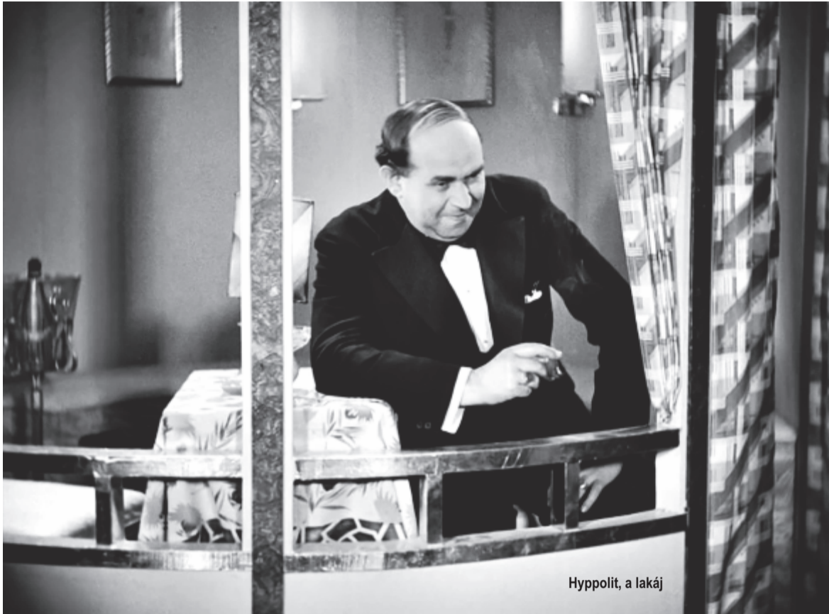
Hyppolit, a lakáj

Két héten át, december 21-től január 4-ig szabadon elérhető száz film a Filmarchívum Vimeo csatornáján.