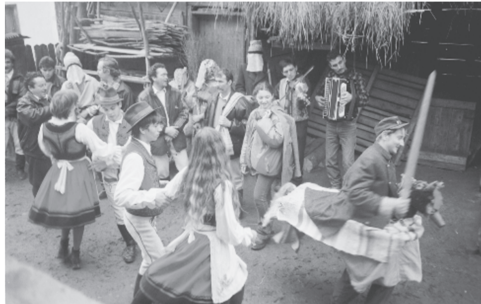
Köszöntő tánc a leányos ház udvarán, elől a falovas

A mai ember számára furcsának tűnhet, hogy aprószentek napján úgy emlékeztek a vértanúkra, hogy egészség- és termékenység-biztosító rítuscselekvést gyakoroltak és varázsszöveget mondtak. Ez az ősi rítuscselekvés itatódott át a betlehemi gyermekgyilkosságra való emlékezéssel és emlé-