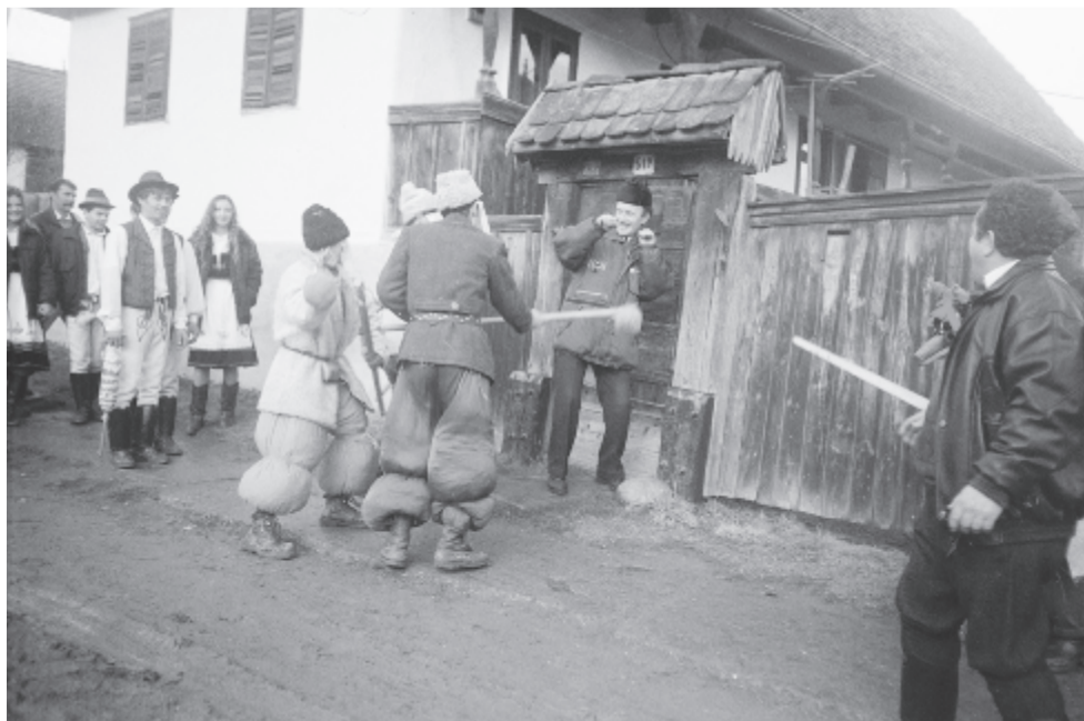
Akióban a hamubotosok

A szokásjáték maszkos alakoskodóit gircsónak, gircsóknak nevezték. Kik ők? Egy falovas , három-négy hamubotos és egy seprős