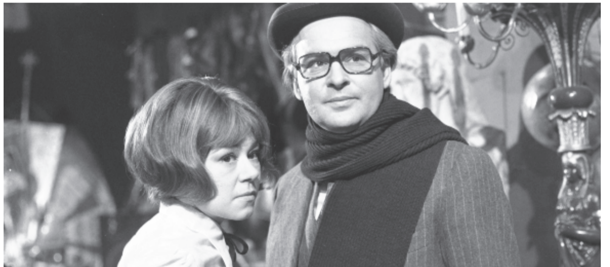
A Pendragon legenda

A válogatással a közönség bepillanthat az archívum munkájába is. Látható a Filmarchívum magyar játékfilmgyűjteményének egyik legkorábbi darabja, az 1912-es Keserű szerelem, de felidézük az első, részben színes nyersanyagra forgatott magyar filmet, Radványi Géza 1941-ben készült, A beszélő köntös című munkáját is, amelynek tízperces színes betétje 15 évvel ezelőtt a Filmarchívum első kísérlete volt a digitális felújításra.