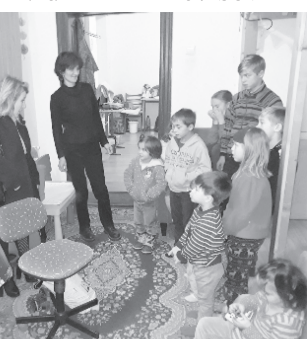
A gyerekek nagy örömmel fogadták az ajándékozót