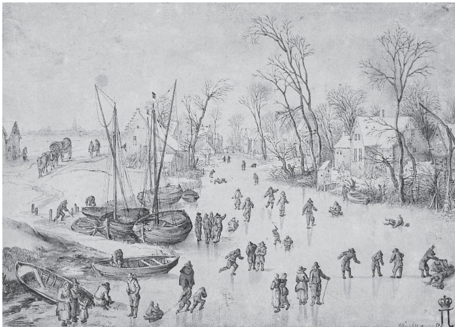
Jan Brueghel: Téli táj (1611)

Adjon az Isten szerencsét, szerelmet, forró kemencét. üres vékamba gabonát, árva kezembe parolát, lámpámba lángot, ne kelljen korán az ágyra hevernem, kérdésre választ ő küldjön, hogy hitem széjjel ne düljön, adjon az Isten fényeket, temető helyett életet nekem a kérés nagy szégyen, adjon úgyvis, ha nem kérem.