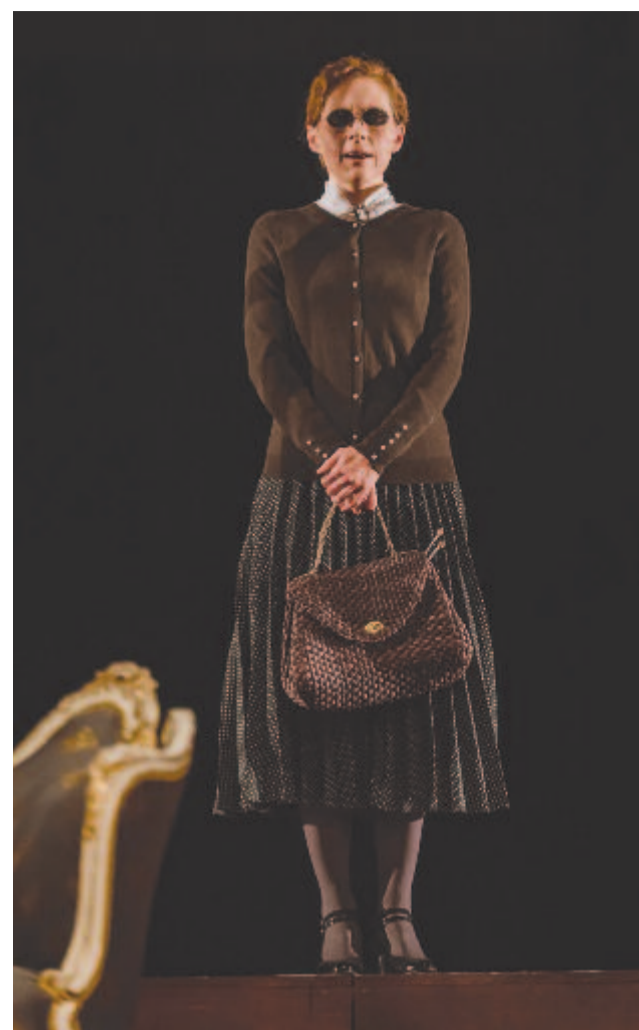
A láthatatlan hóhér