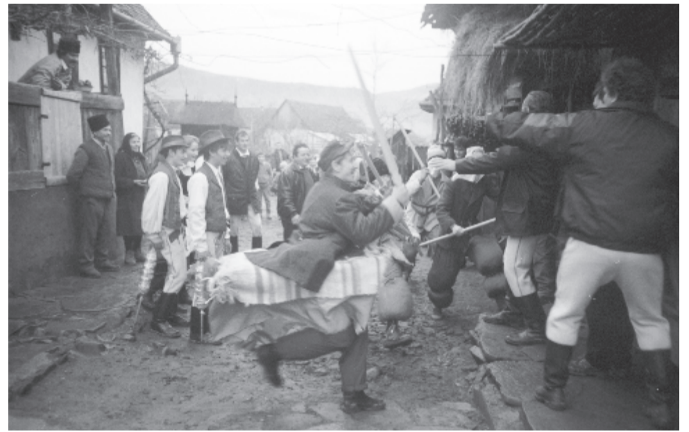
A gircsók játékos ellentámadása

A gircsók némák voltak , vagy csak elváltatott hangon beszélhettek. Szerepkörük viszont jól körülírható cselekvéssort engedélyezett vagy szabott meg számukra. A falovas