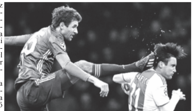
Thomas Müller „fejrúgása” piros lapot ért.

Az E csoportban az Ajax és a Bayern München a csoport első helyéért csapott össze Amszterdamban. A mérkőzés nagy izgalmakat, két piros lapot és két tizenegyet is hozott, és végül 3-3-as döntetlennel zárult. A vezetést a müncheni együttes szerezte meg az első félidő elején, a második játékrészben aztán előbb egyenlített, majd fordított az Ajax, de ez