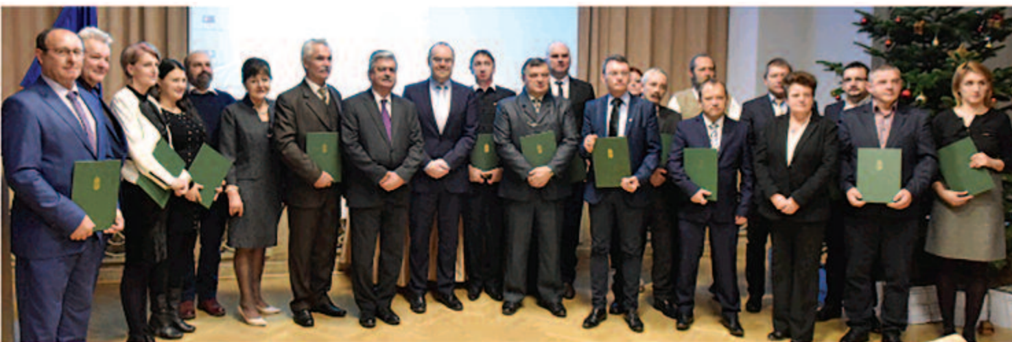
A fórum résztvevői