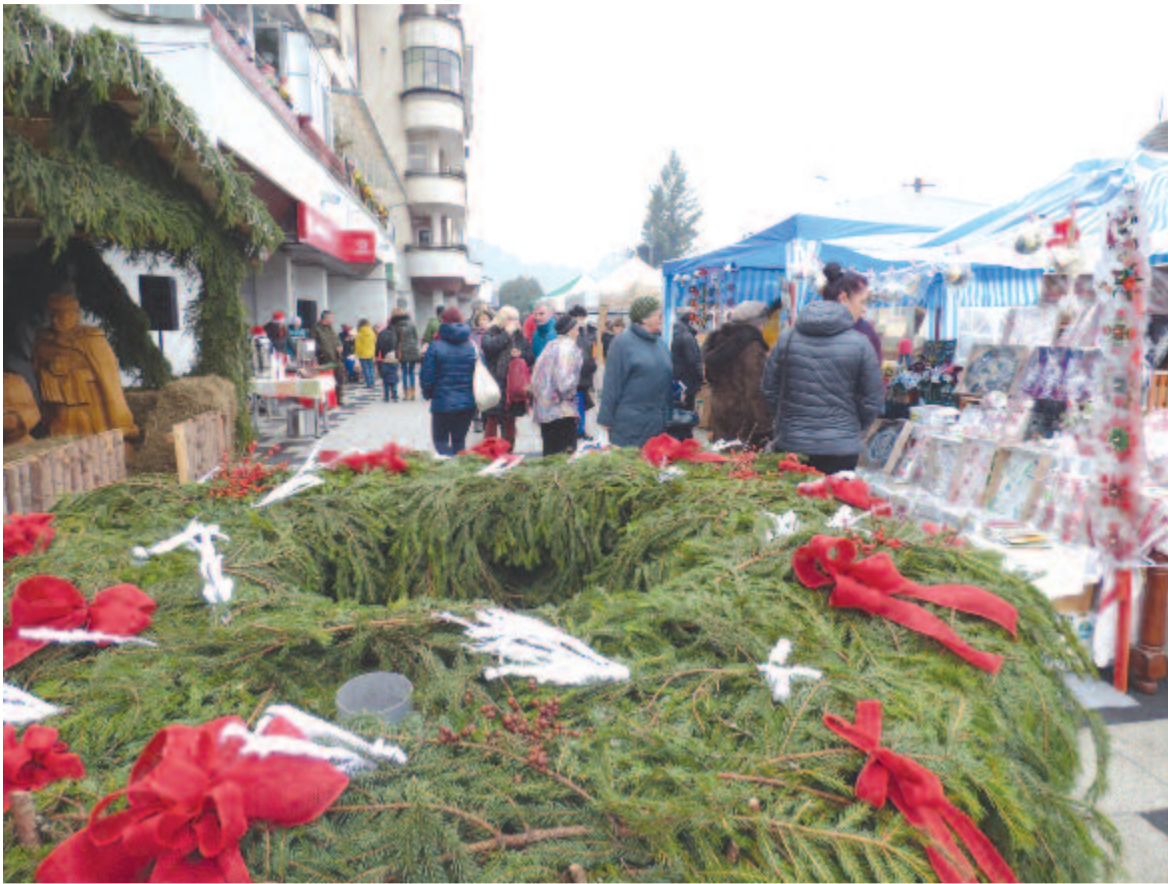
Idén is sokan érdeklődtek a vásár iránt a placcon.

Gazdag programkínálat várja a szovátaiakat, sóvidékieket az adventi időszakban: az önkormányzat, civil szervezetek és egyházak szerveznek kisebb-nagyobb közösségi és jótékonyági eseményeket.