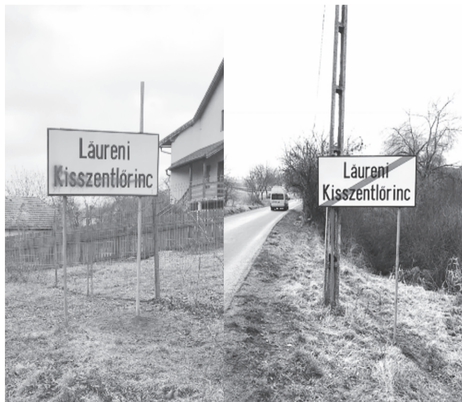
Székelymoson után a Kísszentlőrinc megnevezés is zavaró lett

Bár a nyilatkozatban az szerepelt, hogy „Nyárádszeredában és a hozzá tartozó településeken eddig nem volt hasonló etnikai feszültséget keltő megnyilvánulás”, az igazsághoz hozzátartozik (és később ezt is pontosította az önkormányzat), hogy 2012 januárjában a városhoz tartozó Székelymoson bejáratánál is máig ismeretlen tettes barna festékekkel lemázolta a magyar megnevezést. Értesüléseink szerint a falubeli románokat nem is a magyar felirat, hanem az abban szereplő Székely-előtag zavarta. Akkor a városvezetés azt ígérte, hogy hamarosan kicserélik a táblát, de az a mai napig is a helyén van – igaz ugyan, hogy időközben a barna festék szinte teljesen lepattogzott róla, így ismét olvasható a magyar megnevezés is. Mivel jelenleg a Székelymosonon áthaladó községi utat korszerűsítik, ennek befejeztével pedig új helységnevtáblákat helyeznek el, a polgármestert megkérdeztük: nem tart-e attól, hogy ismét lefestik a magyar megnevezést Székelymosonban? Az előljáró egyelőre nem számol ezzel a lehetőséggel. (GRL)