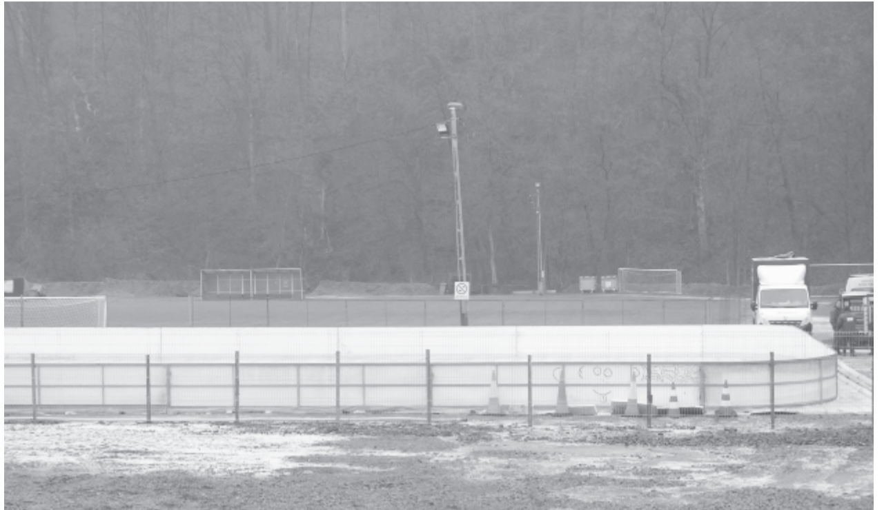
A hét végén még dolgoztak a pálya feltöltésén, szerdától lehet siklani

versenyprogram bemutatásával is megörvendeztetni a közönséget, amely a nyitóestén ingyenesen léphet jégre. Csütörtöktől a pályát a már megszokott program szerint vehetik igénybe a korcsolyázást kedvelők: délelőttöként 10 és 12 óra, délután 17 és 18.30 között, majd egy rövid „pihentető” után este 19 és 20.30 óra között ismét lehet siklani a városi sporttelepen kialakított létesítményen. A délelőtti belépés 3 lejbe kerül, délután 5 lej kell fizetni – értesültünk Gál Krisztától , az önkormányzat szóvivőjétől. (gligor)