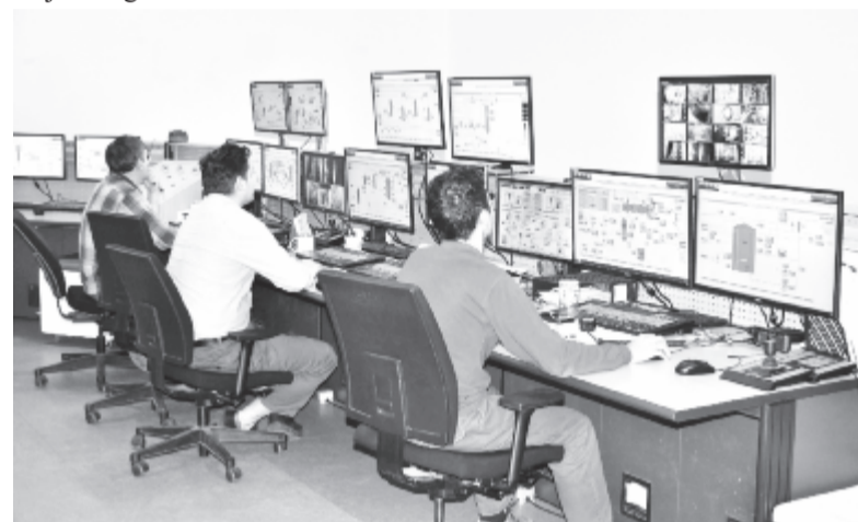
A termelőrszleg korszerű vezérlőterme

sebb ráfordítással feljavíthatják a talaj cink-, magnézium- és szulfát-tartalmát, amivel a kukoricatermesztést segíthetik. Ehhez azonban azt a műtrágyatípust kell választani, amelyet – az adott növények szükségletét figyelembe véve – a talaj összetételének és az időjárási viszonyoknak megfelelően adott időszakban kell adagolni.