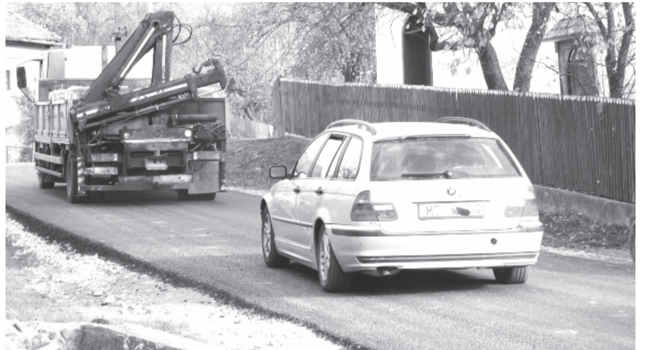
Sima aszfaltúton folyik a közlekedés