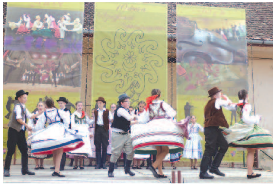
Szombaton az ünneplésen, a táncon volt a hangsúly

A Márton-napi vásárt ötödik alkalommal tartották meg a kastélyudvaron, ahol számos erdőszentgyörgyi termelő mellett bözödi, gyulakutaiak, kendiek is kínálták termékeit, de érkeztek Kébélből, Nyárádgálfalváról, Koronkából is. Száraz és festett virágok, őszi dekorációk, tökből készült dísz tárgyak, népviseleti darabok, szőttesek mellett levendulás illat-