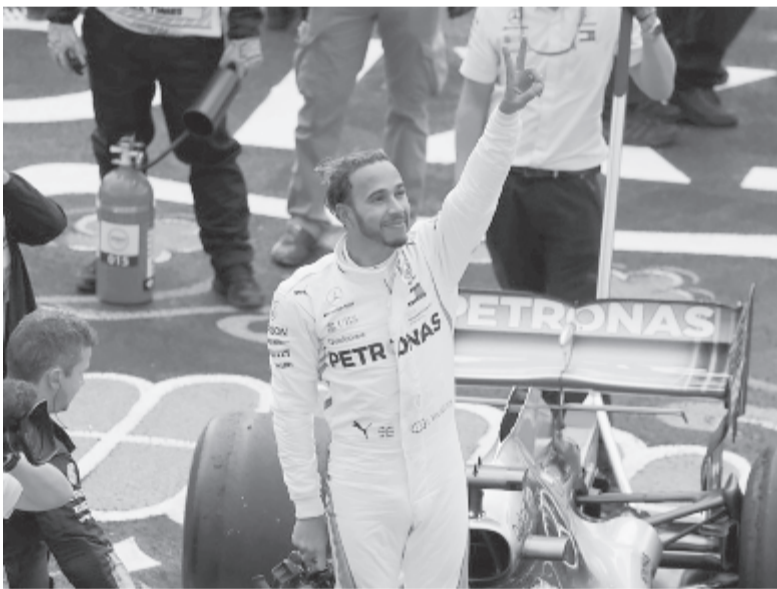
Ötödszörre koronázták meg a brit versenyzőt, így immár minden idők egyik legjobb pilótájaként tartják számon

A vasárnapi futamon Hamilton a harmadik helyről egészen kiválóan kapta el a rajtot, megelőzte a pole pozícióból startoló Daniel Ricciardót (Red Bull), de a második kockából induló Verstappent nem tudta kikerülni az első kanyar előtt. A negyedik-ötödik helyen Vettel és Hamilton csapattársa, Valtteri Bottas küzdött egymással,